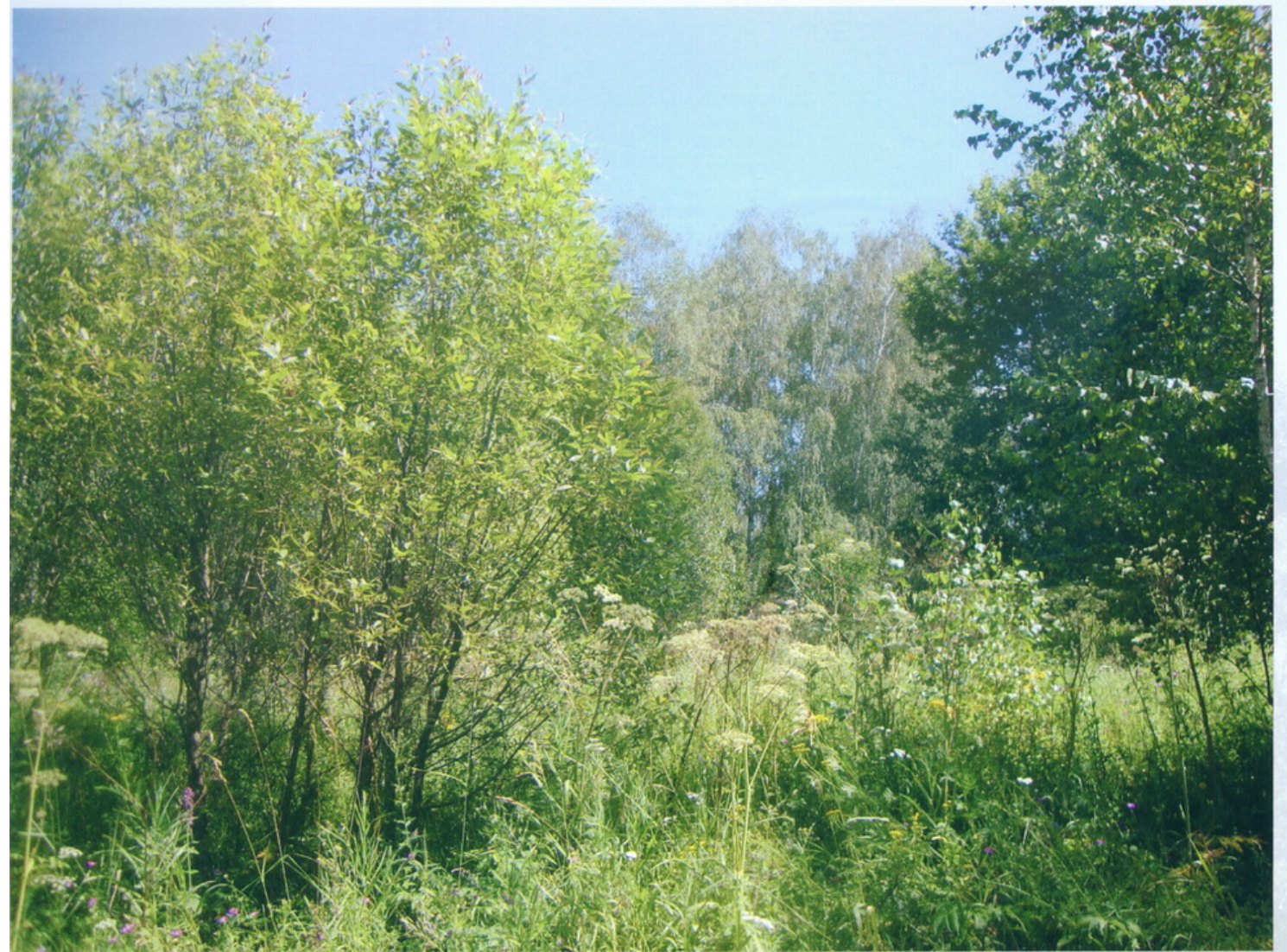
Коюланово Дорота на Святой источник