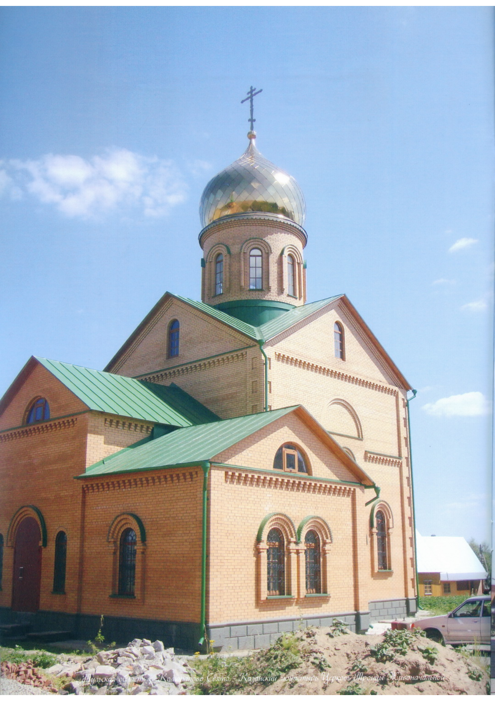
Идульская область - Калужское Свято - Казанский монастырь Церковь Троицы Живоначальной