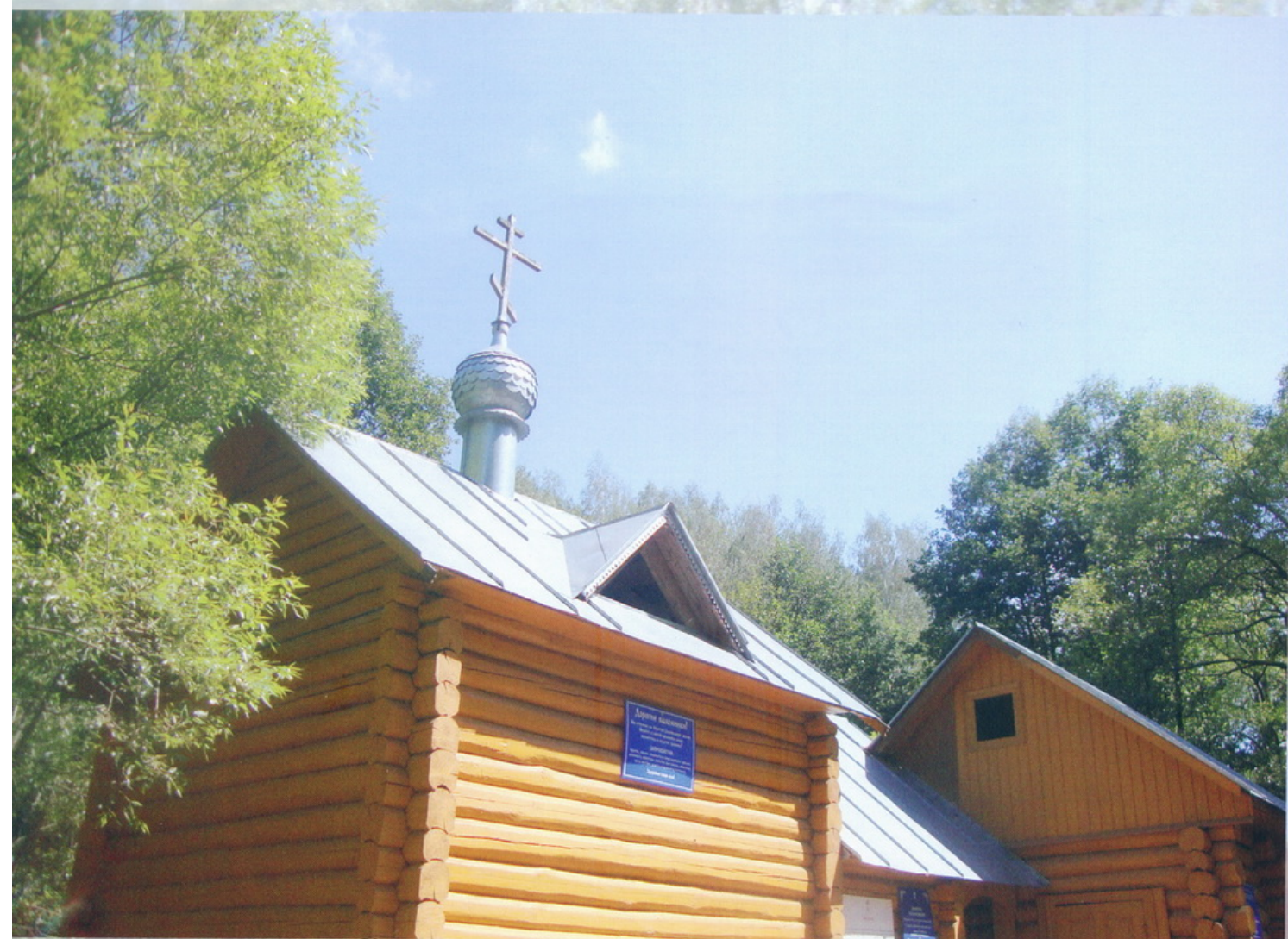
с. Колюпаново Святой источник блаженной Евфросинии