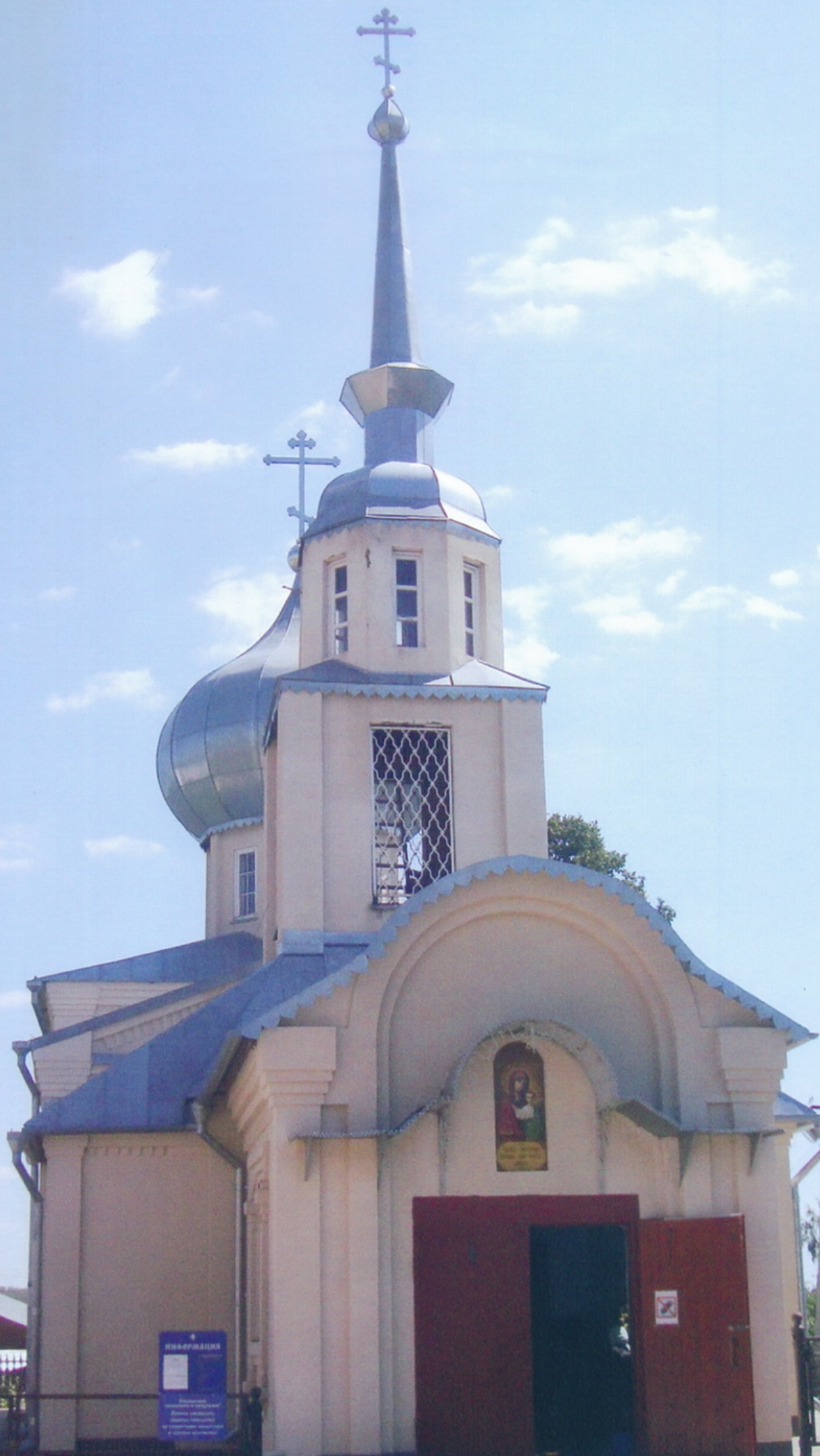
Тульская область с. Колюпаново Свято - Казанский монастырь Церковь Казанской иконы Божией Матери