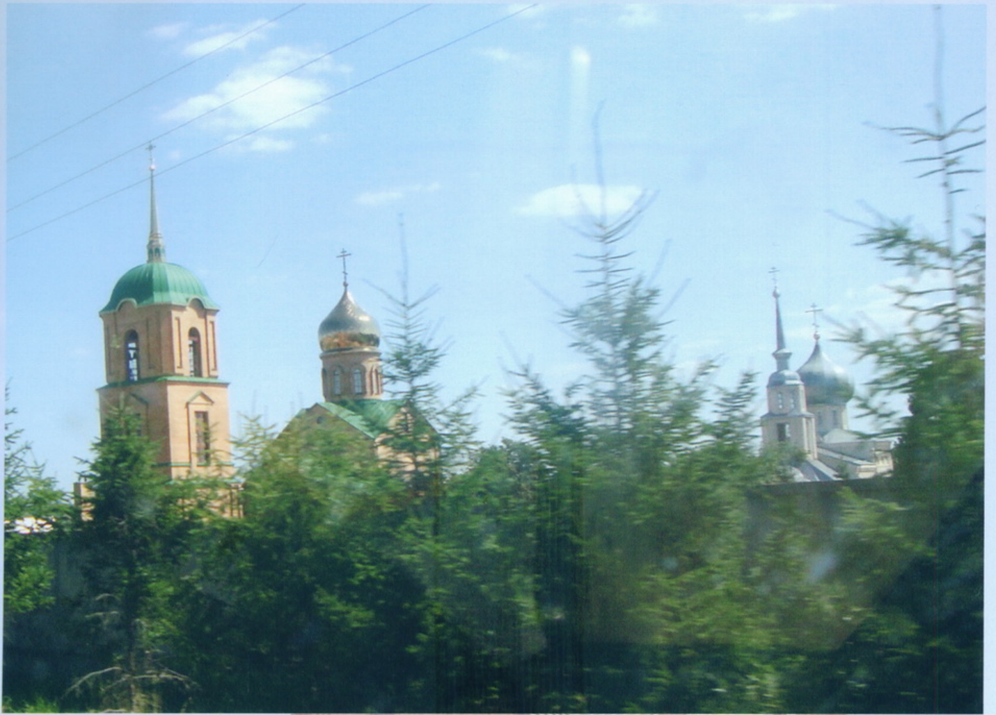
Тульская область с. Колупаново Свято - Казанский монастырь