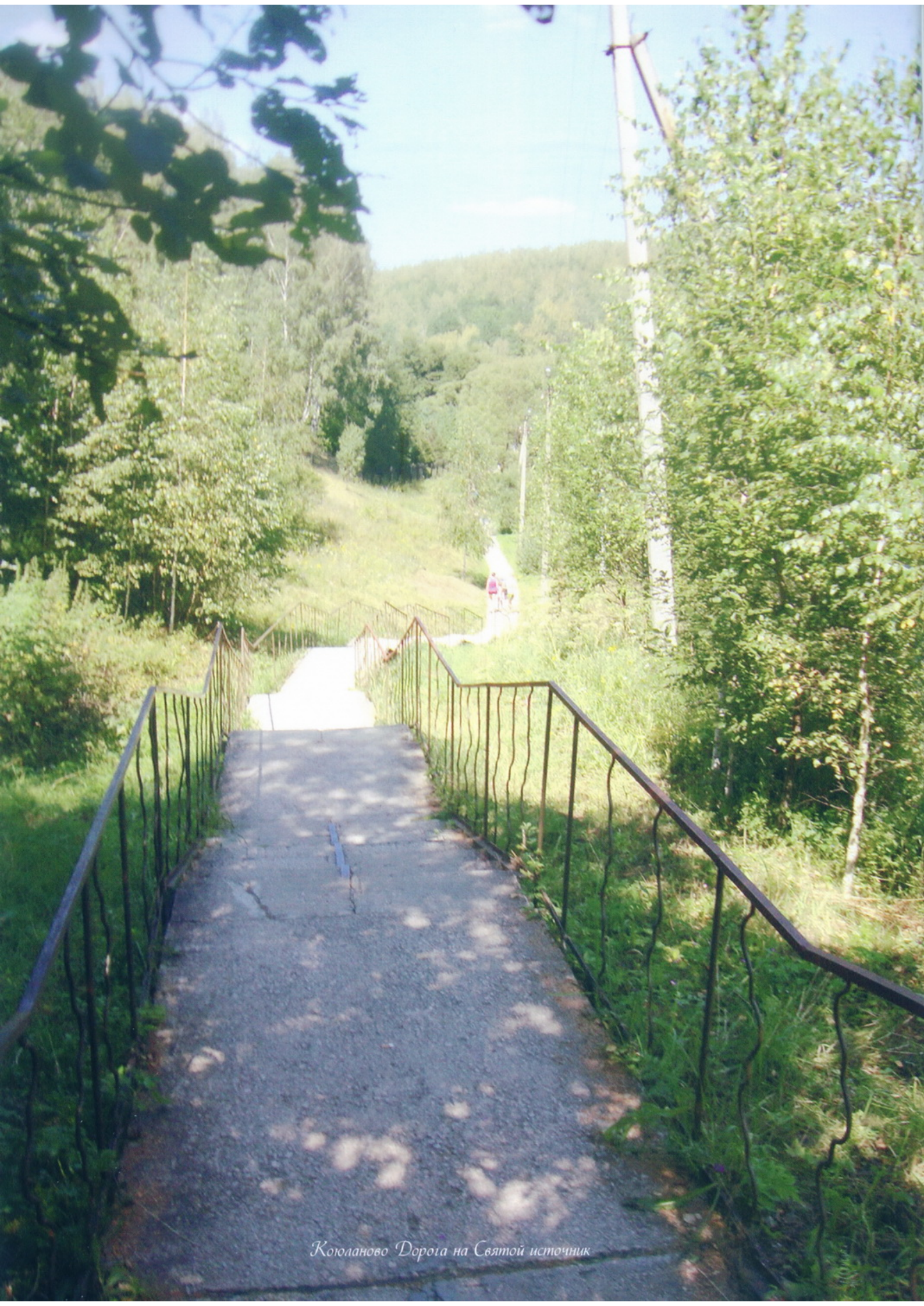
Кююланово Дорога на Святой источник