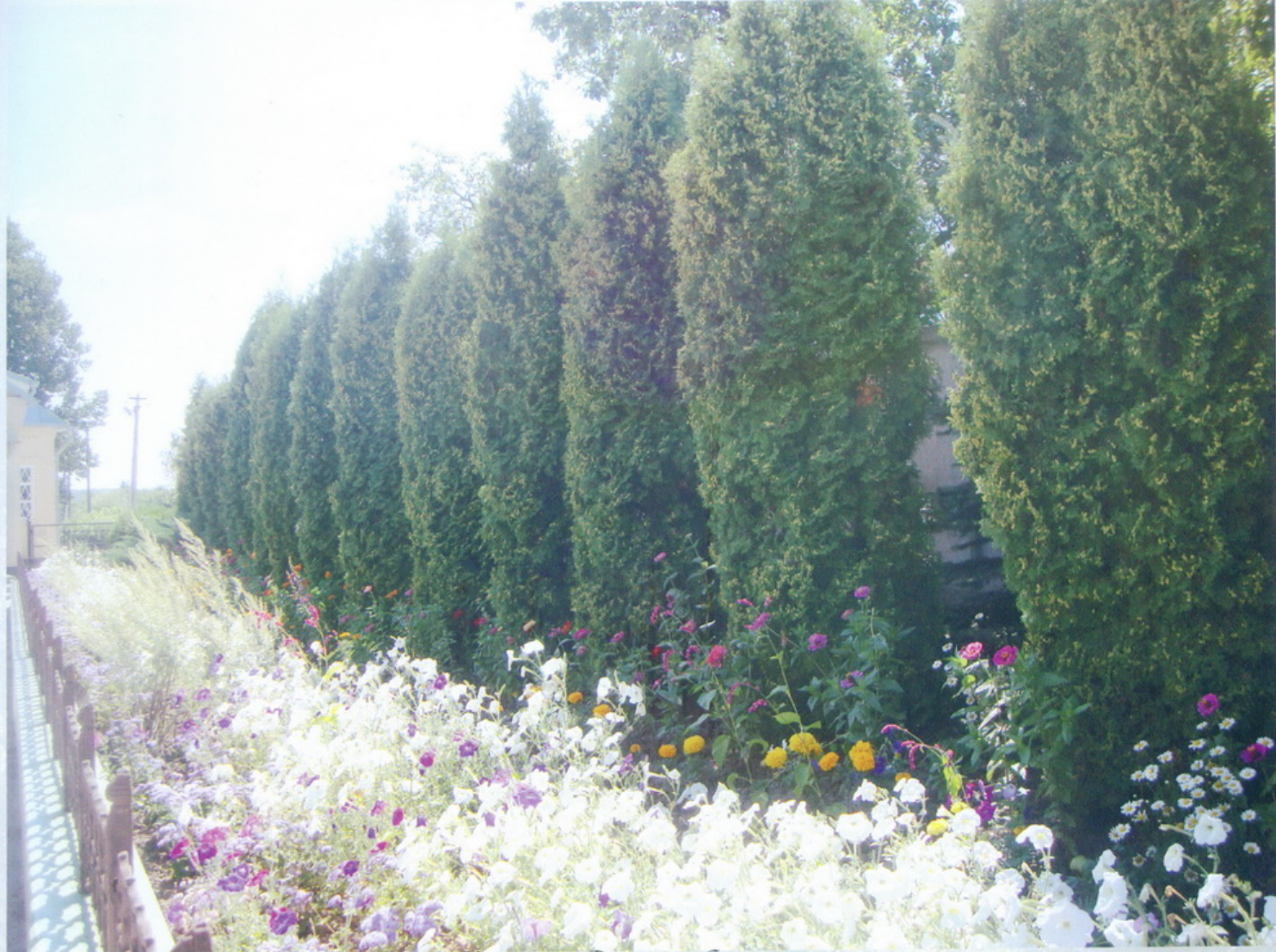
Коюланово Дорога на Святой источник