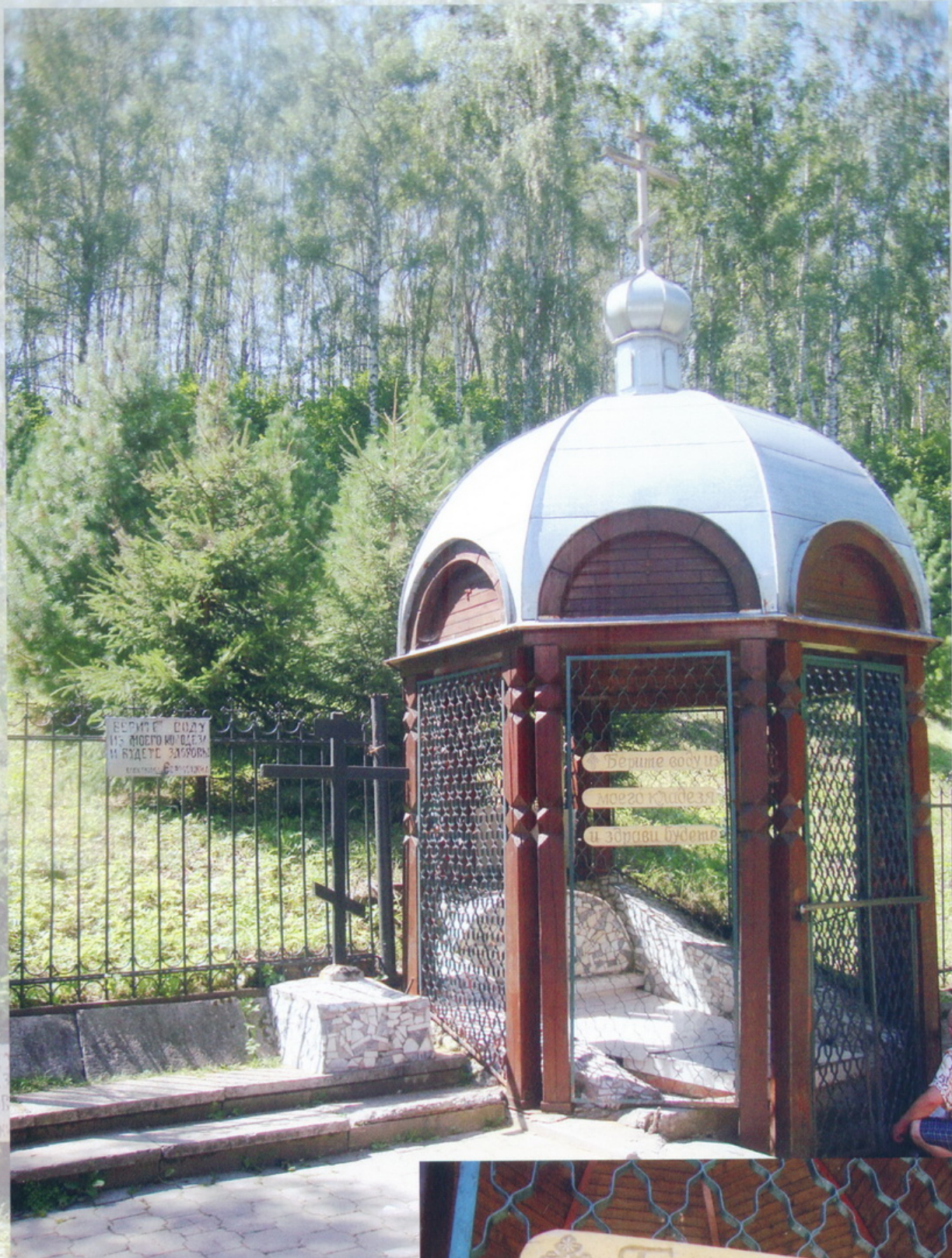
с. Колупаново Святой источник блаженной Евфросинии