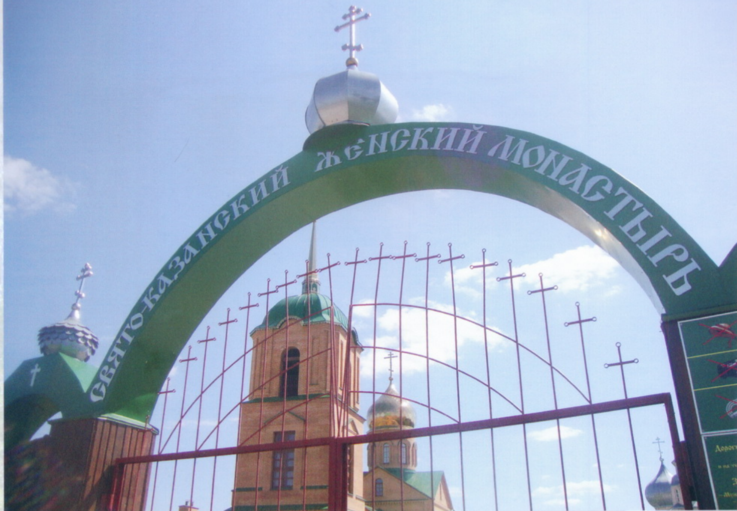
Тульская область с. Колюпаново Свято - Казанский монастырь

Память о блаженной Евфросинии жила в народе. На источник, выкопанный столетней старицей, приходили люди, молились и получали исцеление. Сохранилось в памяти и предсказания Евфросинии, что на месте её погребения будет стоять женская обитель.