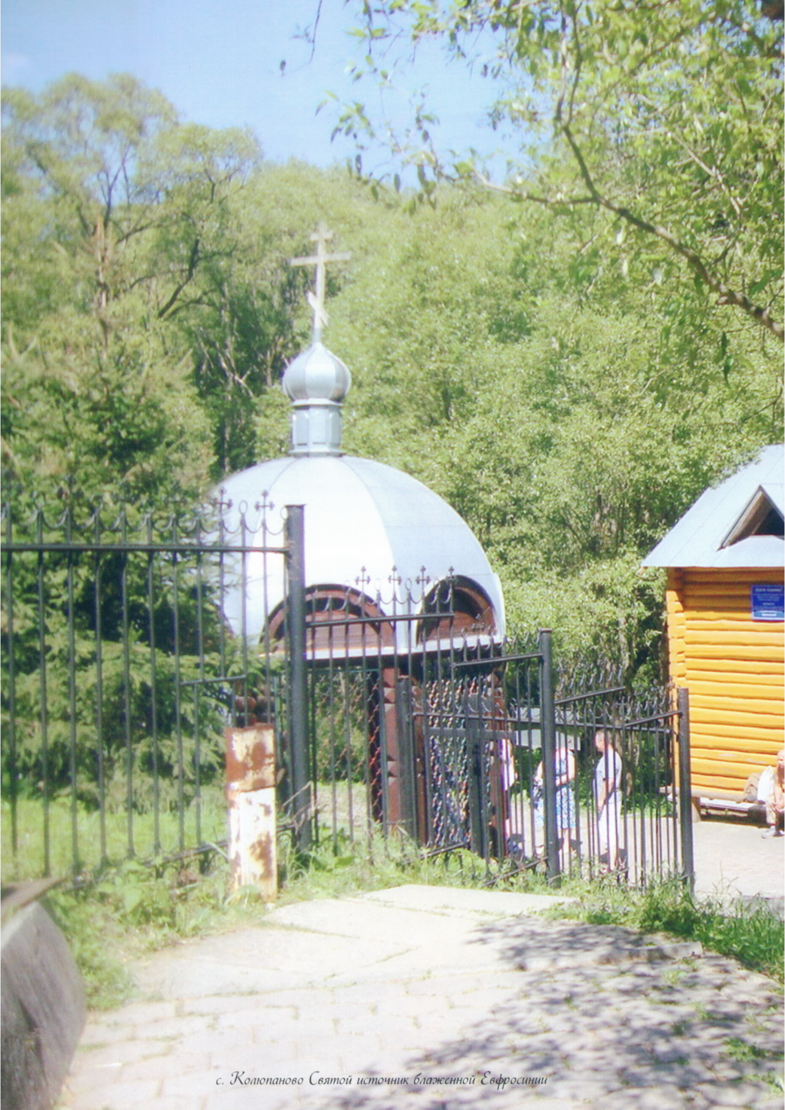
с. Колупаново Святой источник блаженной Евфросинии