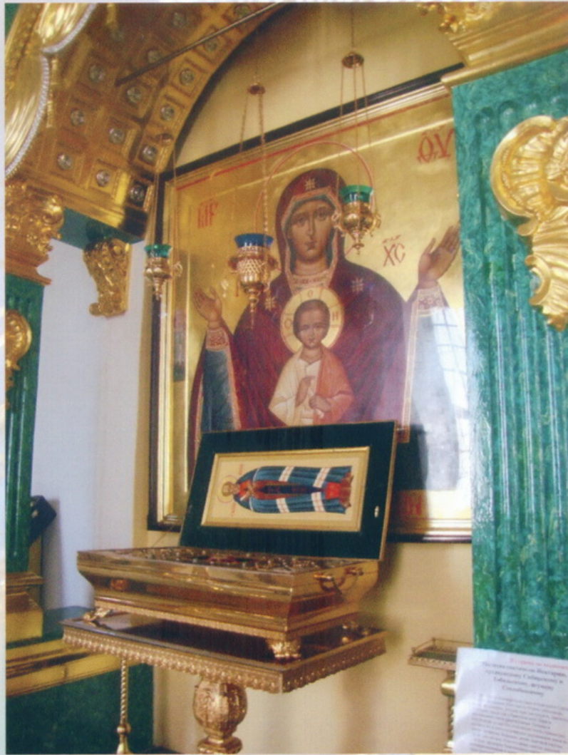
Мощевик с частичками мощей святых, в том числе с частичкой мощей почитаемого в Нило-Столобенской пустыни святителя Нектария, архиепископа Сибирского и Тобольского, иумисна Столобенского