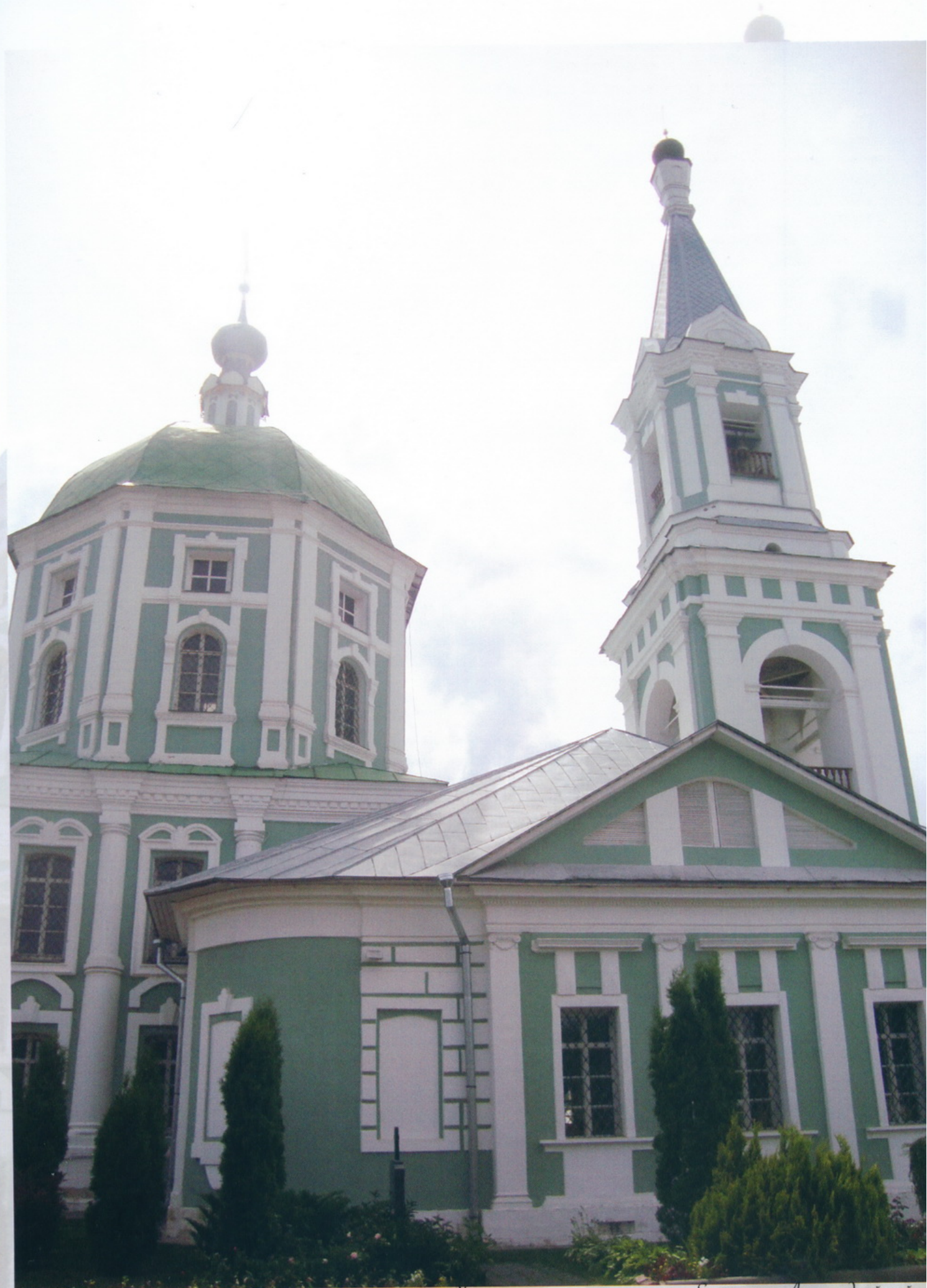
Тверь Свято-Екатерининский женский монастырь Храм в честь великомученицы Екатерины Александрийской