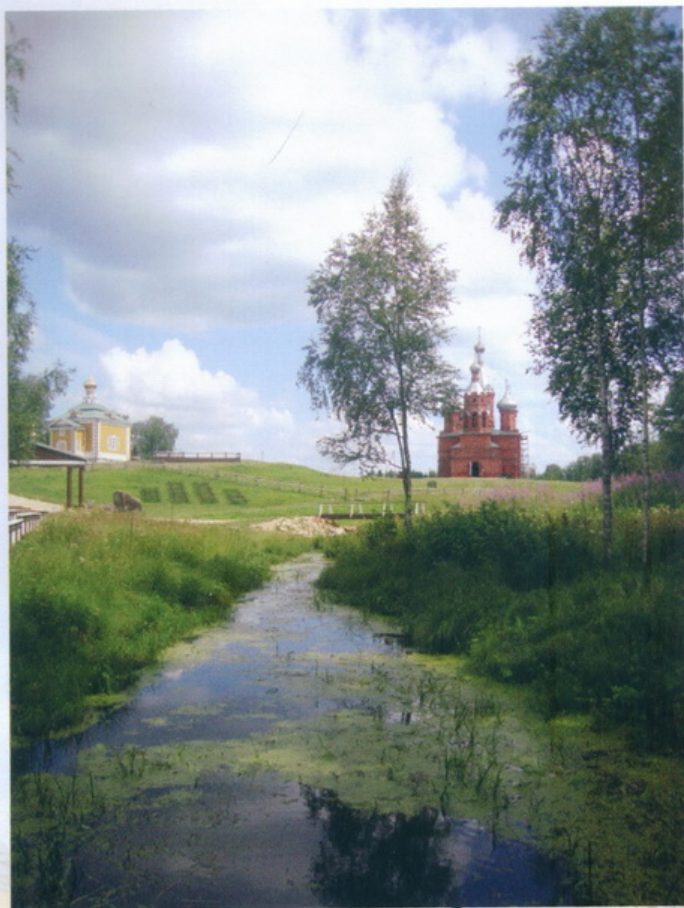
Воловерховье Исток Волги