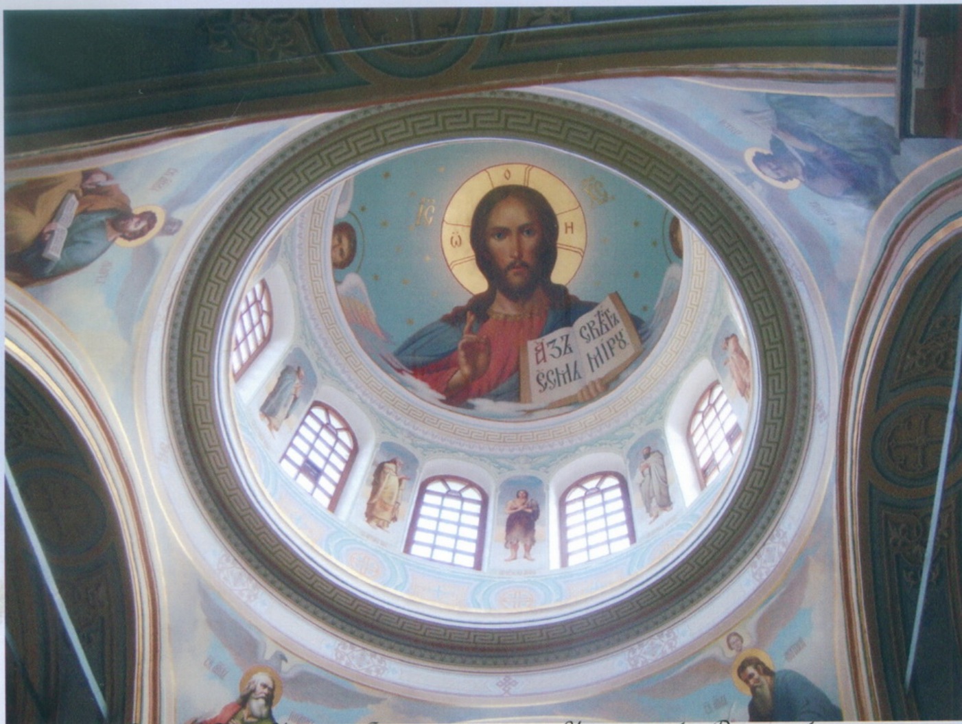
Старица Свято-Успенский Старицкий монастырь Успенский собор Роспись собора Некрополь монастыря