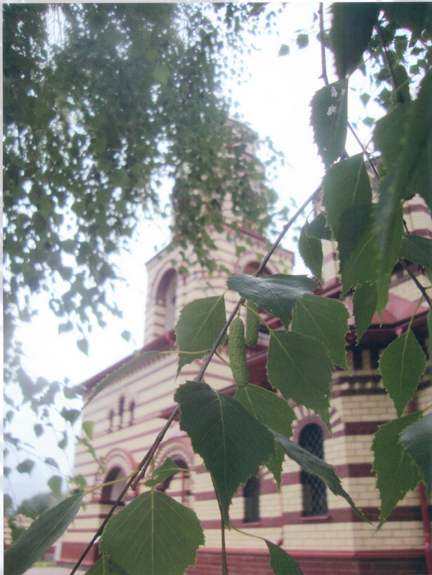
Тверская область Николо - Малица Николаевский Малицкий мужской монастырь