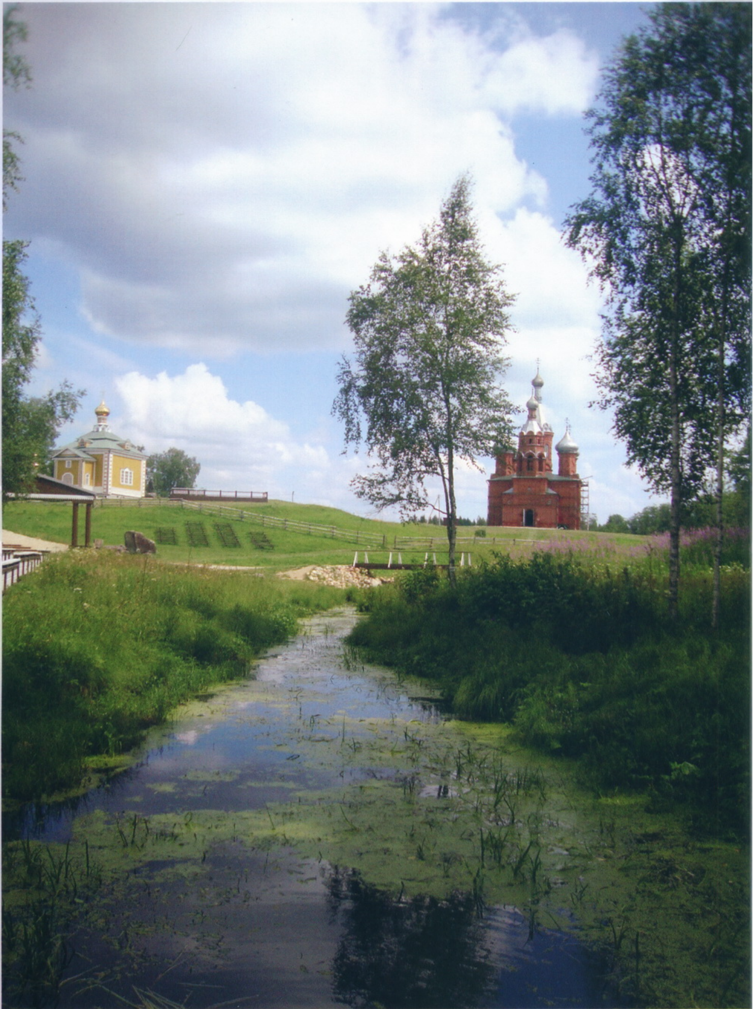
Воловерховье Исток Воли