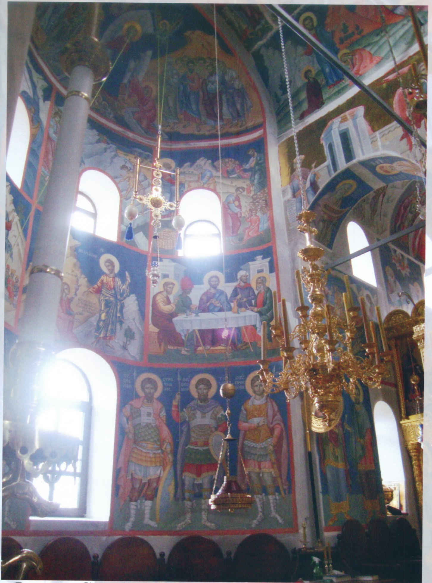
Тверская область Николо - Малица Николаевский Малицкий мужской монастырь церковь Покрова Пресвятой Богородицы Роспись собора