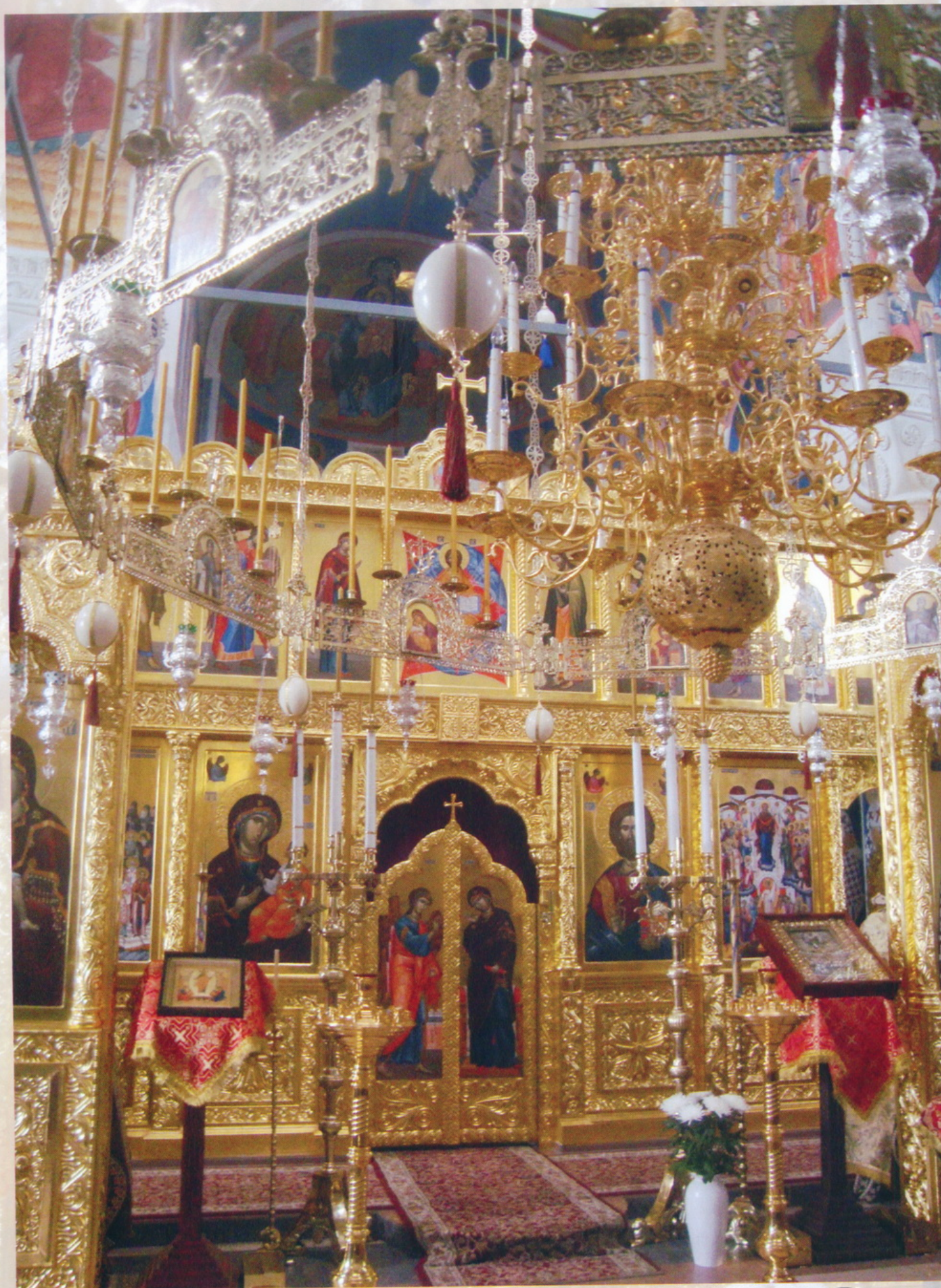
Тверская область Николо - Малица Николаевский Малицкий мужской монастырь церковь Покрова Пресвятой Богородицы Иконостас