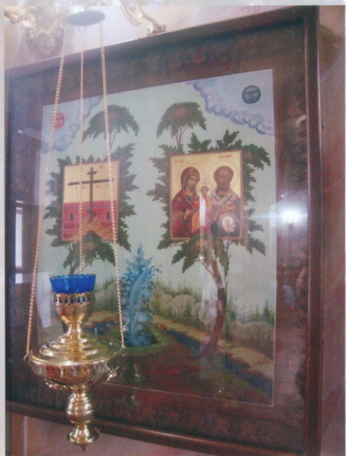
Тверская область Чудотворный Оковецкий святой источник около Селижарово Церковь во имя иконы Божией Матери "Одигитрии" и Святой Оковецкий источник