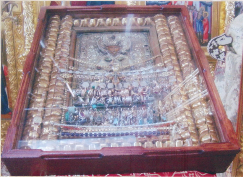
Чудотворная Икона Святителя Николая Чудотворца