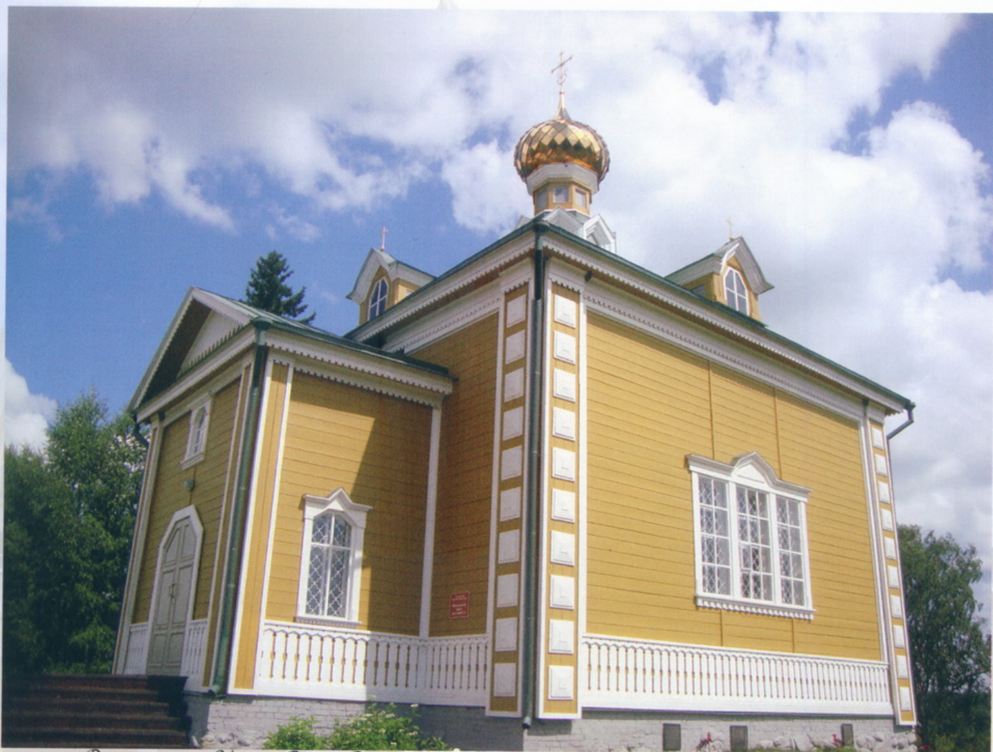
Воловверховье Исток Воли Олынский монастырь Церковь святителя Николая Чудотворца

Именно в этом месте на поверхность выходит великая река, и ширина ее меньше метра. А сама часовня относится к Олыину монастырю в Воловверховье, и здесь ежегодно проходит Крестный ход и с освящением воды в источнике.