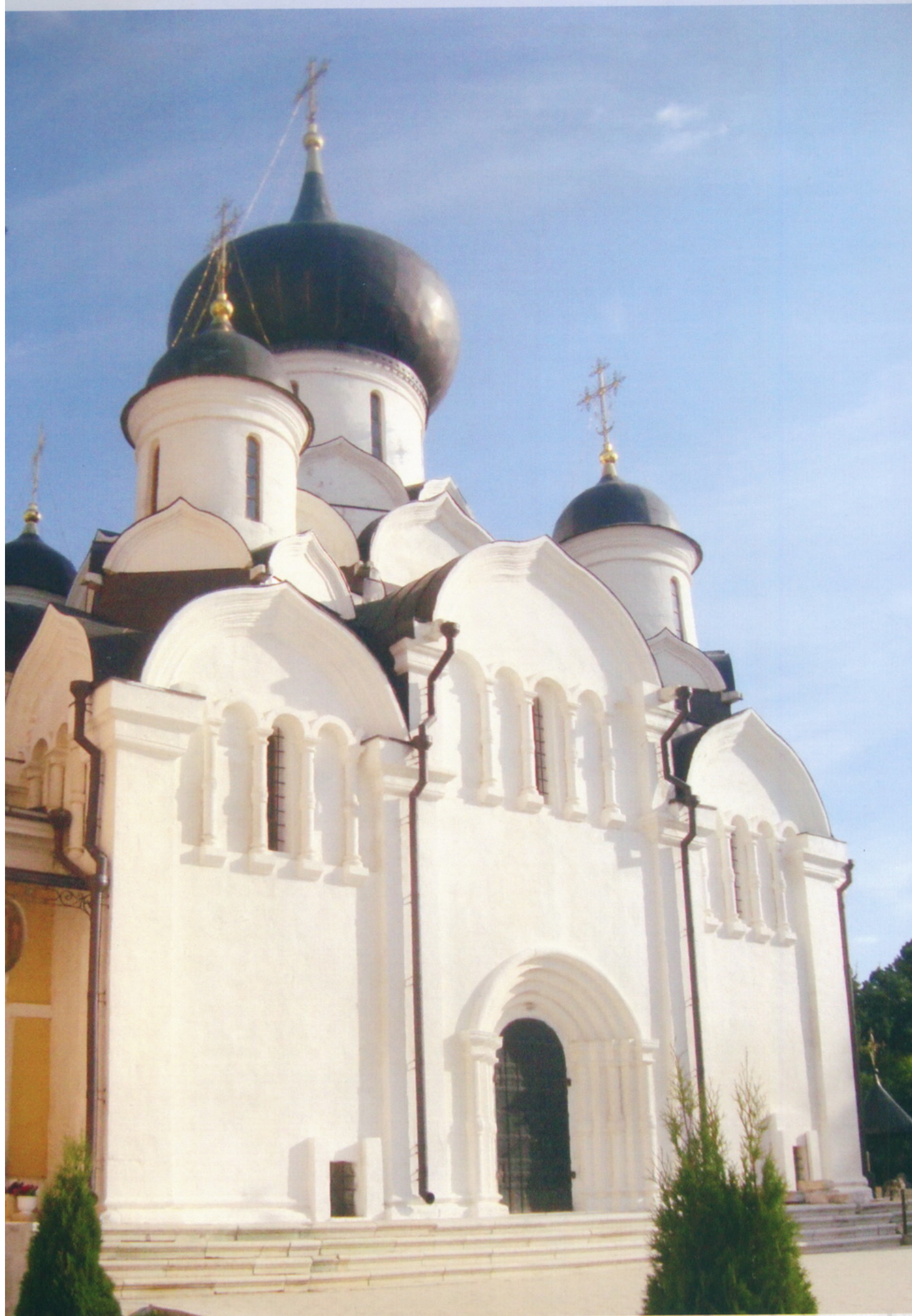
Старица Свято-Успенский Старицкий монастырь Успенский собор