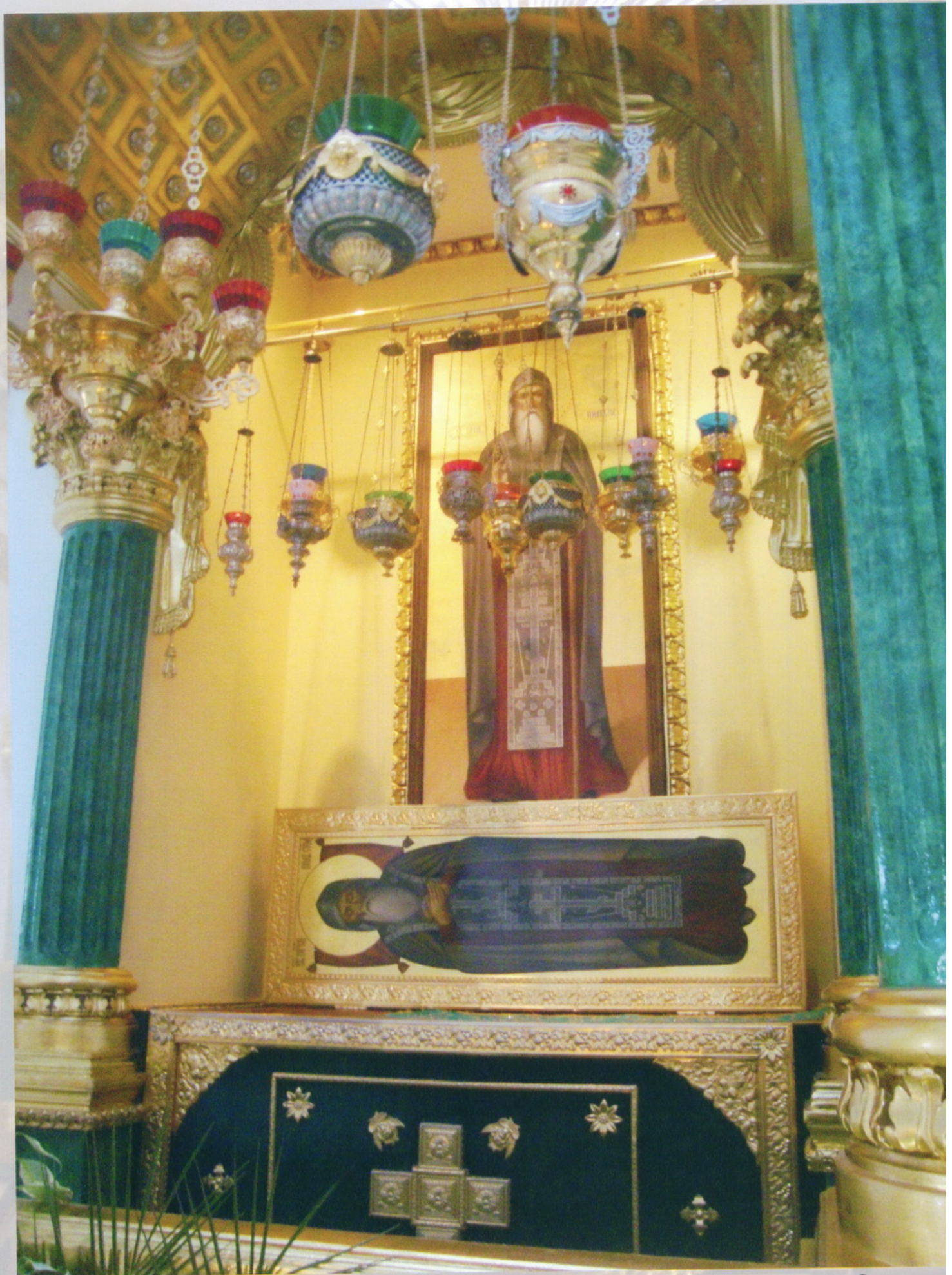
Тверская область озеро Селигер остров Столобный Монастырь Жило-Столобенская пустынь Собор Богоявления Господня Рака с мощами преподобного Фила Столобенского