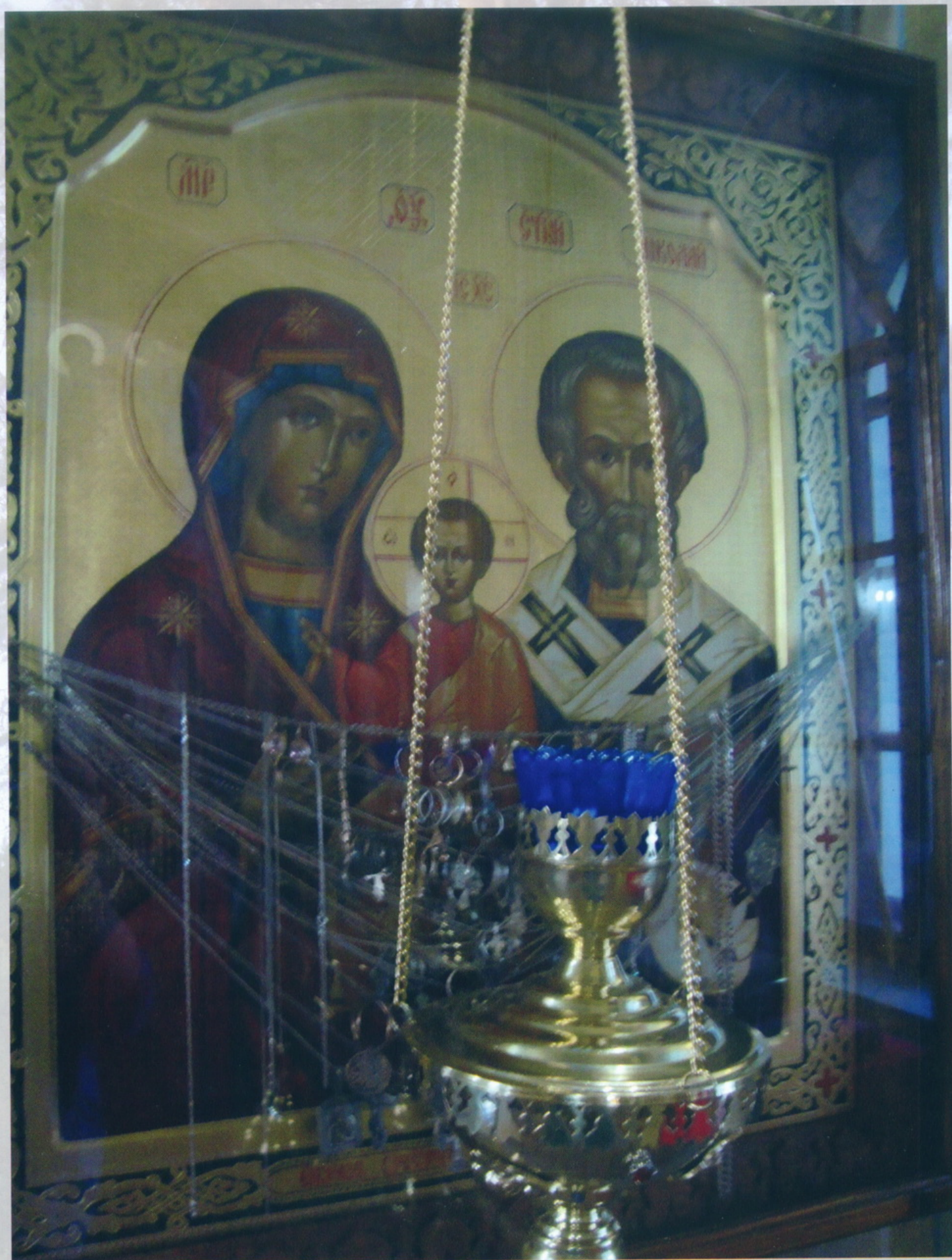
Тверская область Чудотворный Оковецкий святой источник около Селижарово д. Оковцы Чудотворная икона Богоматери с Предвечным Младенцем на левой руке и стоящим рядом святителем Николаем Чудотворцем