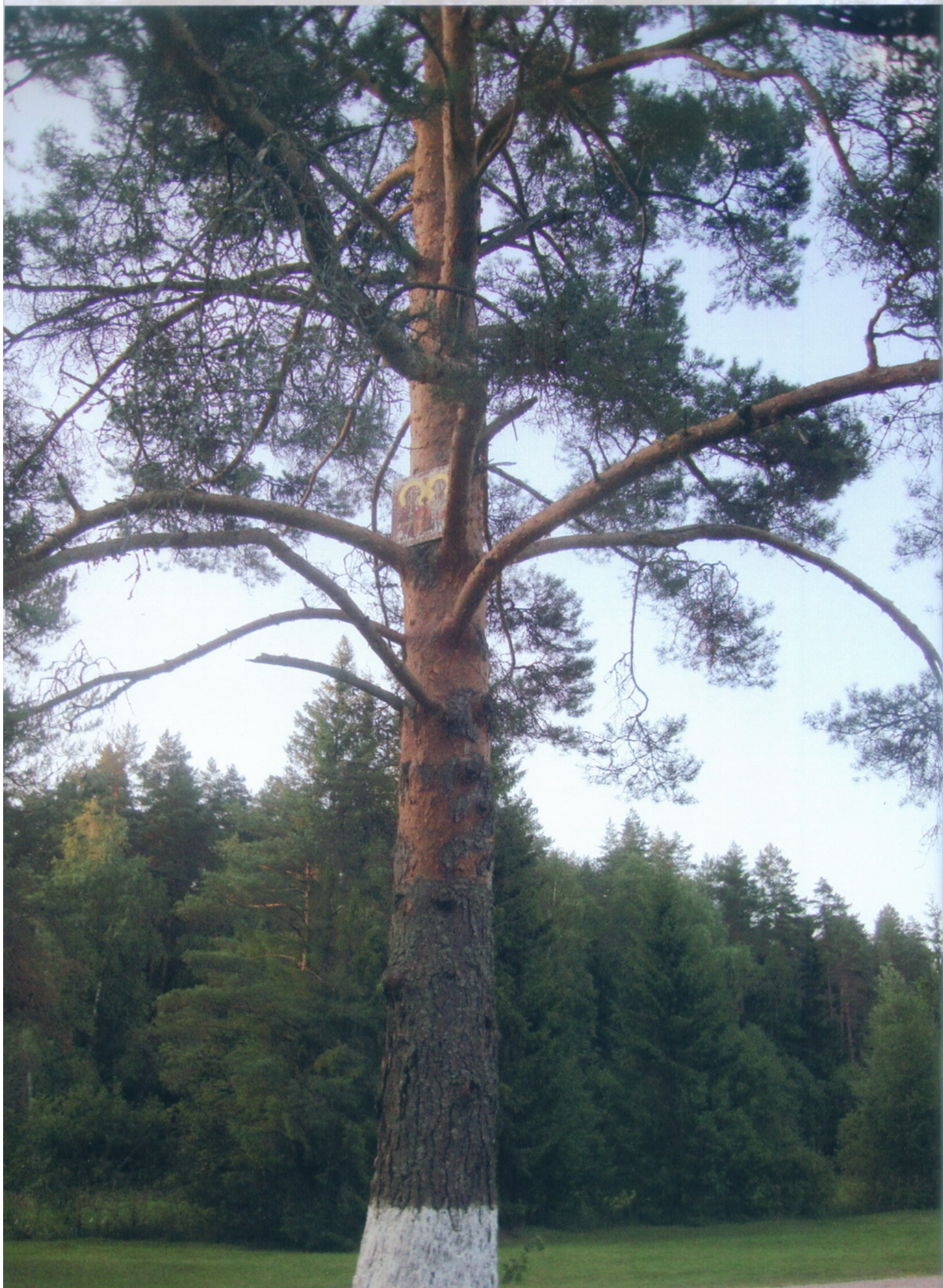
Тверская область Чудотворный Оковецкий святой источник около Селижарово д. Оковцы