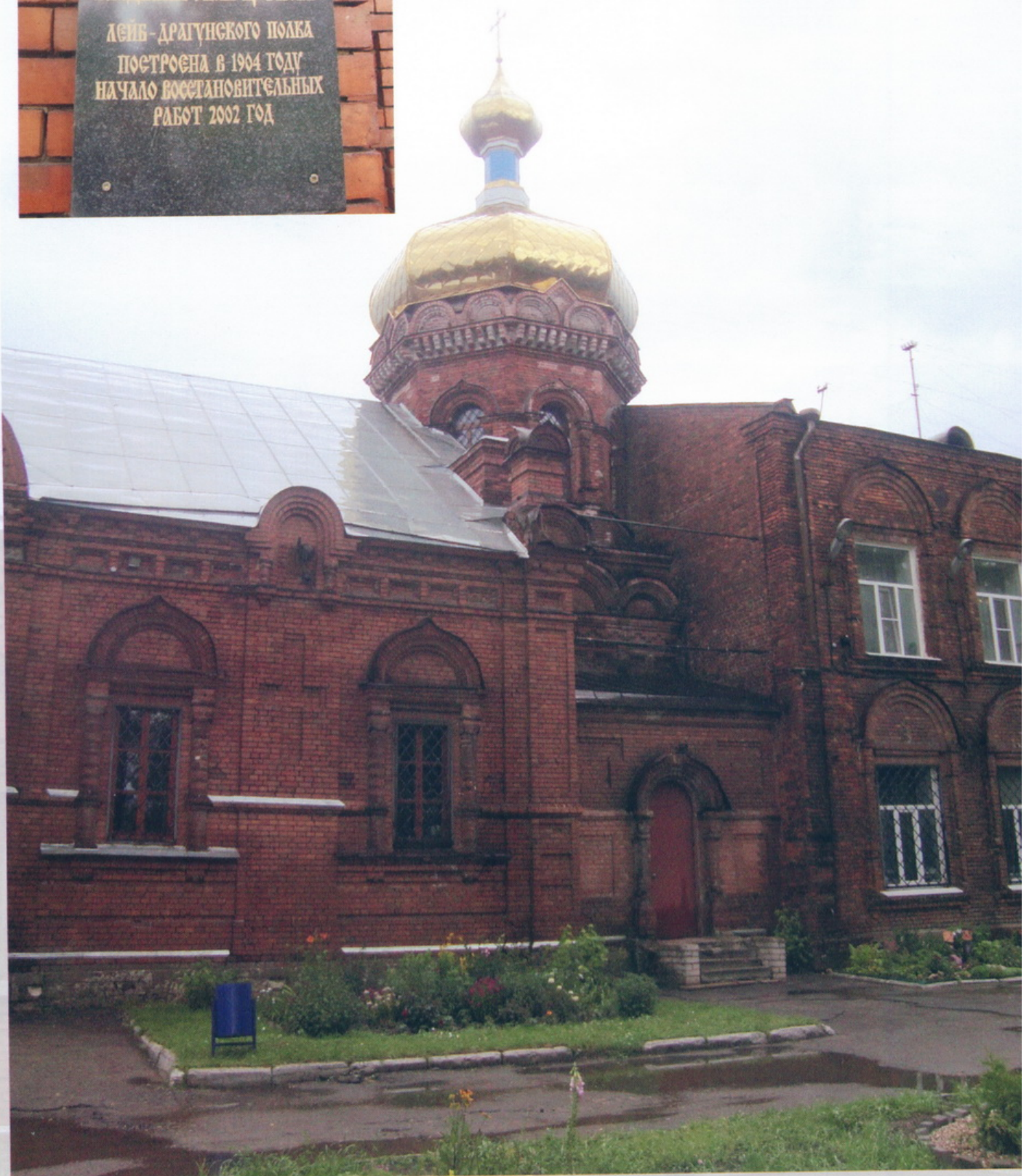
Тверь Церковь Иконы Владимирской Божией Матери