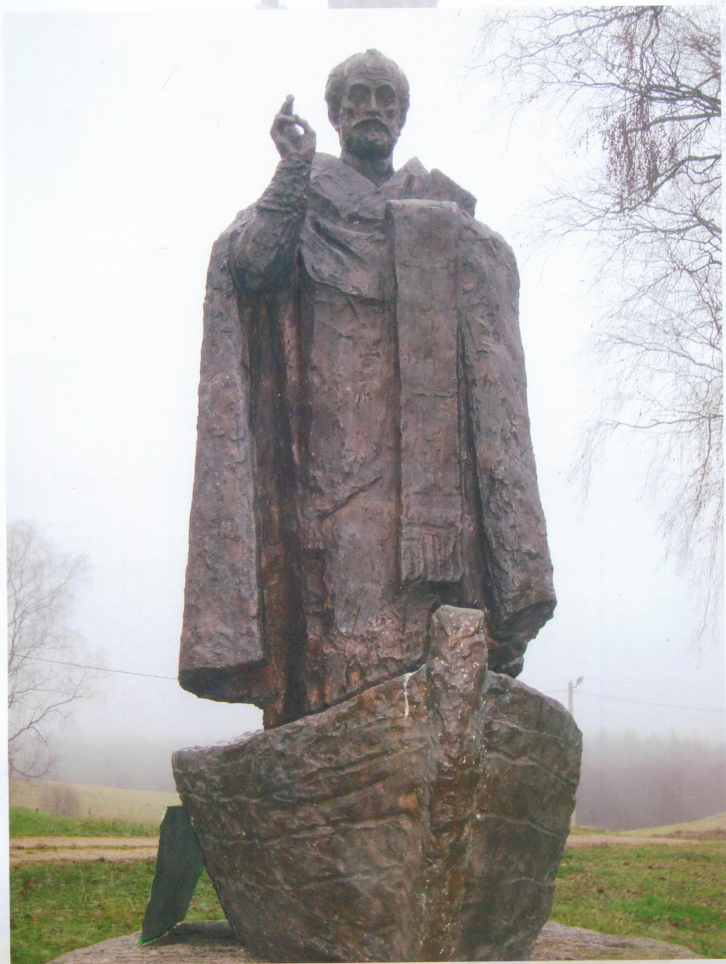
Воловерховье Памятник святителю Николаю