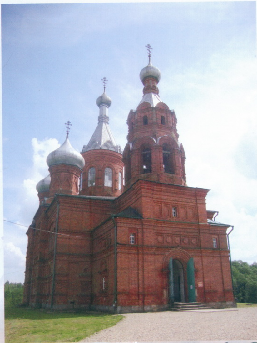
Воловерховье Исток Воли Ольгинский монастырь Церковь Спаса Пресображения Церковь святителя Николая Чудотворца