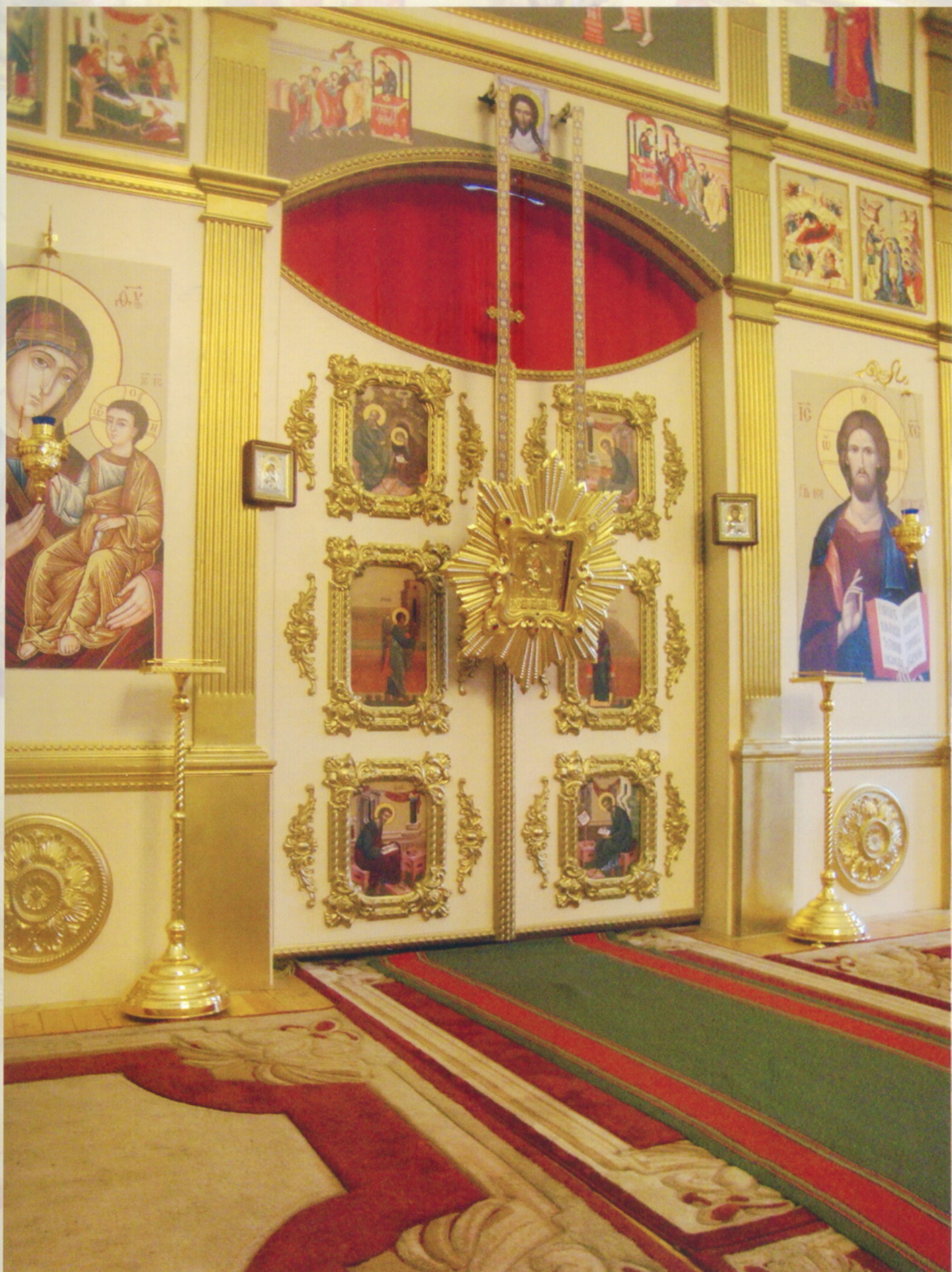
Тверь Церковь Иконы Владимирской Божией Матери Иконостас с почитаемой иконой Божией Матери Почасвская