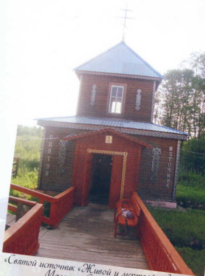
«Святой источник «Живой и мертвой воды» в д. Маслово, Старицкий район

А памятники природы? Не только знаменитыми пещерами славится Старицкий край... Отдельная тема — усадьбы.