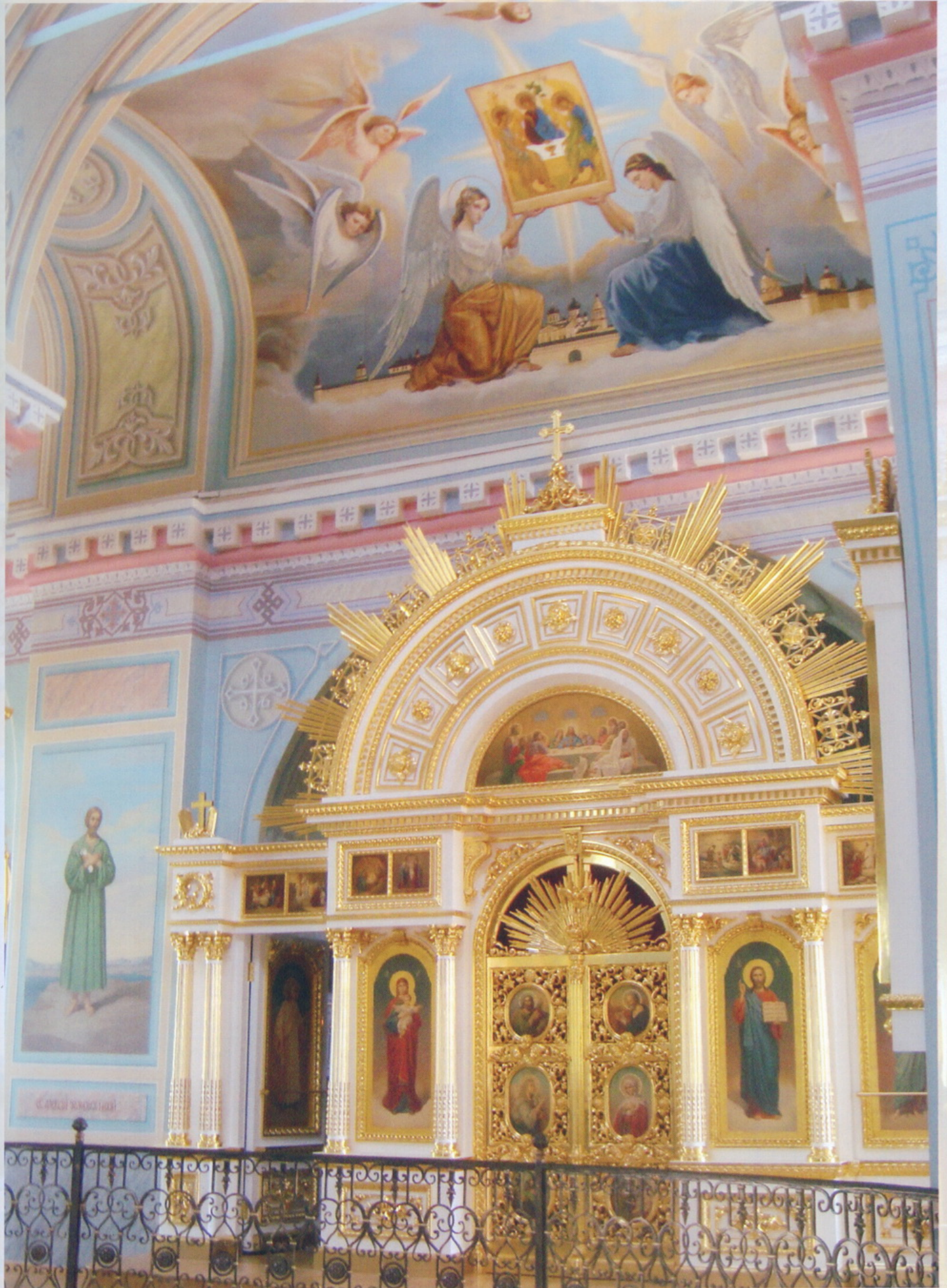
Старица Свято-Успенский Старицкий монастырь Успенский собор Иконостас