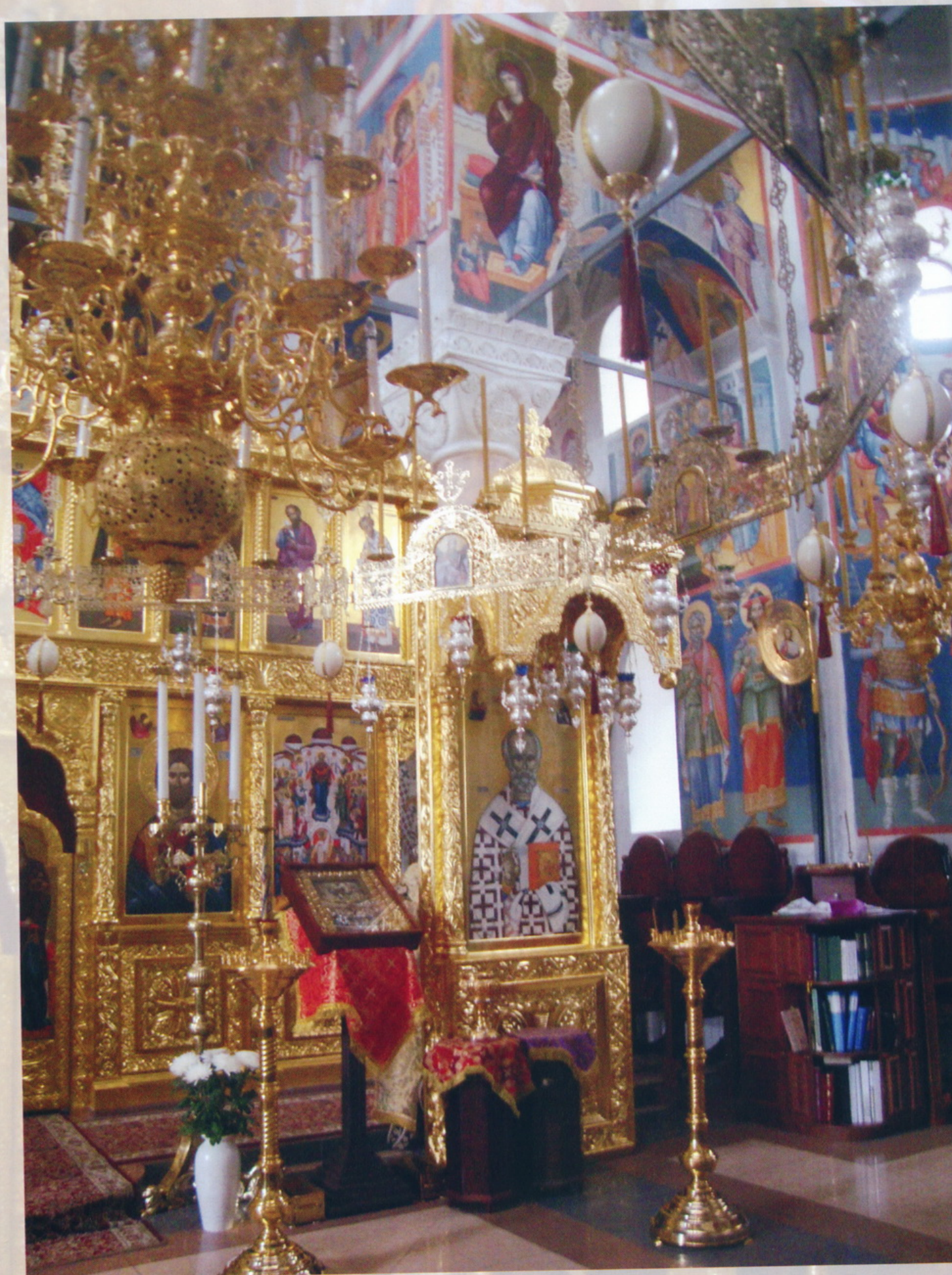
Тверская область Николо - Малица Николасвский Малицкий мужской монастырь церковь Покрова Пресвятой Богородицы Иконостас