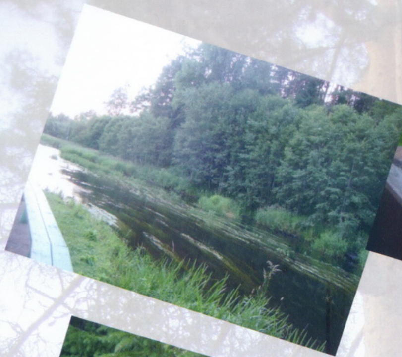
На Святом Оковецком источнике