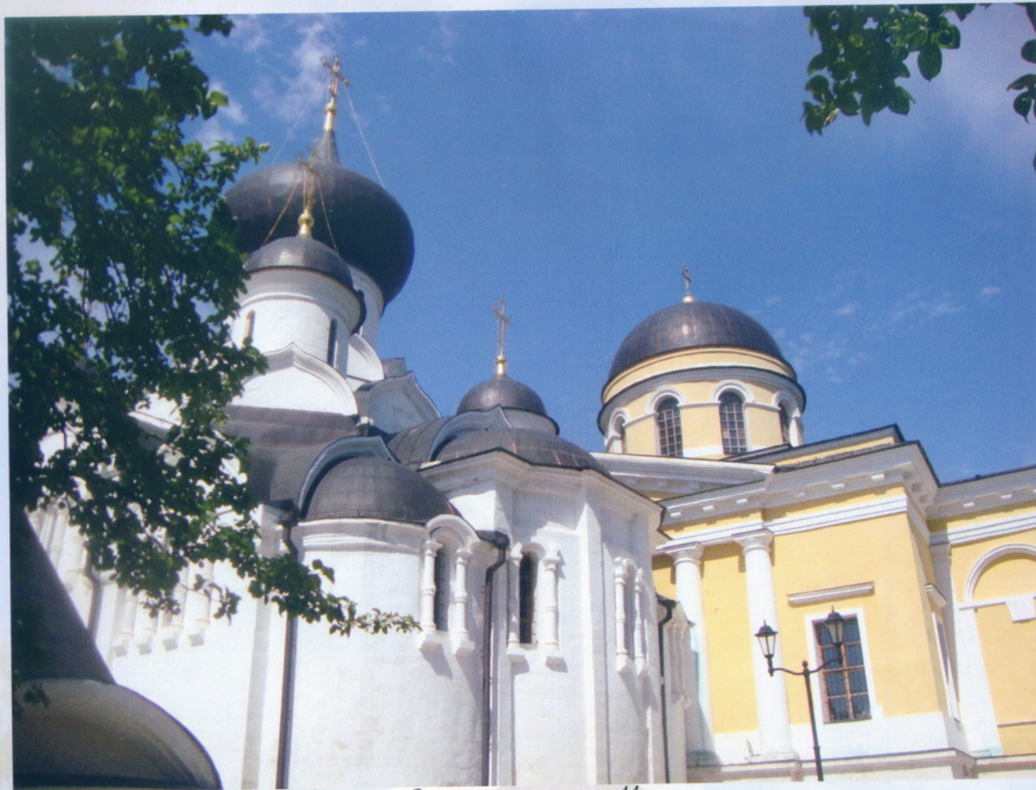
Старица Свято-Успенский Старицкий монастырь Монастырские храмы Мост через реку Волгу