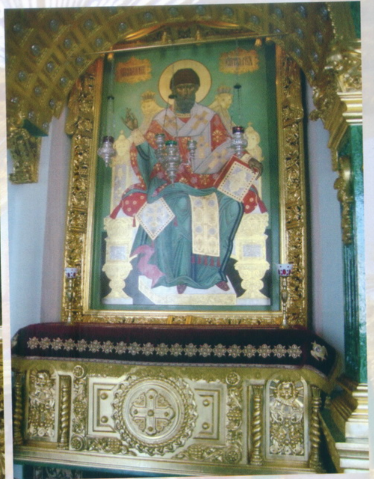
Тверская область озеро Селигер остров Столобный Монастырь Фило-Столобенская пустынь Собор Богоявления Господня Казанская икона Божией Матери и Икона Святителя Спиридона Тримифунтского Рака с мощами преподобного Фила Столобенского