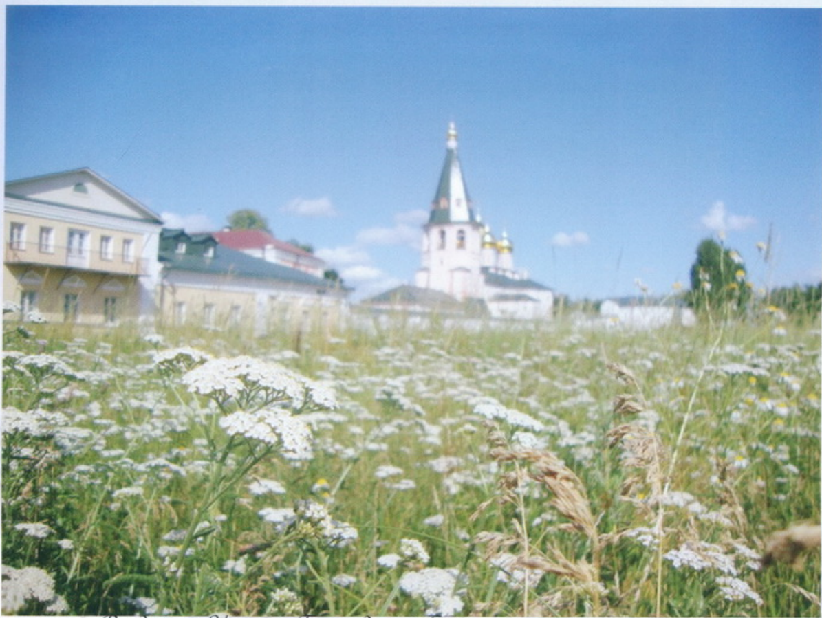
Валдайский Иверский Богородицкий Святоозерский мужской монастырь

Считается, что икона, привезенная на Валдай, была выполнена в 1656 году русскими иконописцами, отправленными патриархом на Афон. Но существует и другое предание, согласно которому Никон, пользуясь пребыванием в Москве Иверского архимандрита Пахомия, просил снять с Чудотворной иконы Иверской Богоматери точную копию и прислать ее в Москву вместе с планом Иверской обители. Икона была доставлена в 1648 году. В Москве ее торжественно встречали государь Алексей Михайлович со всеми церковными иерархами и народом. В Валдайский Иверский монастырь икона была привезена патриархом Никоном уже в 1656 году на освящение нового каменного собора. Копия чудотворной иконы осталась в столице. Для нее рядом с Красной площадью была построена часовня.