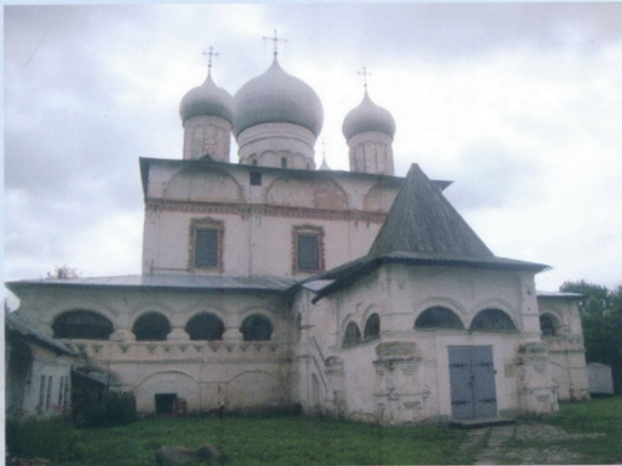
Знаменский собор в Великом Новгороде

В Великом Новгороде есть интересная достопримечательность, которая не всегда включена в туристические маршруты – это Знаменский собор-музей. Место удивительно атмосферное, а внутри собора сохранилась замечательная роспись стен, разглядывать которую одно удовольствие.