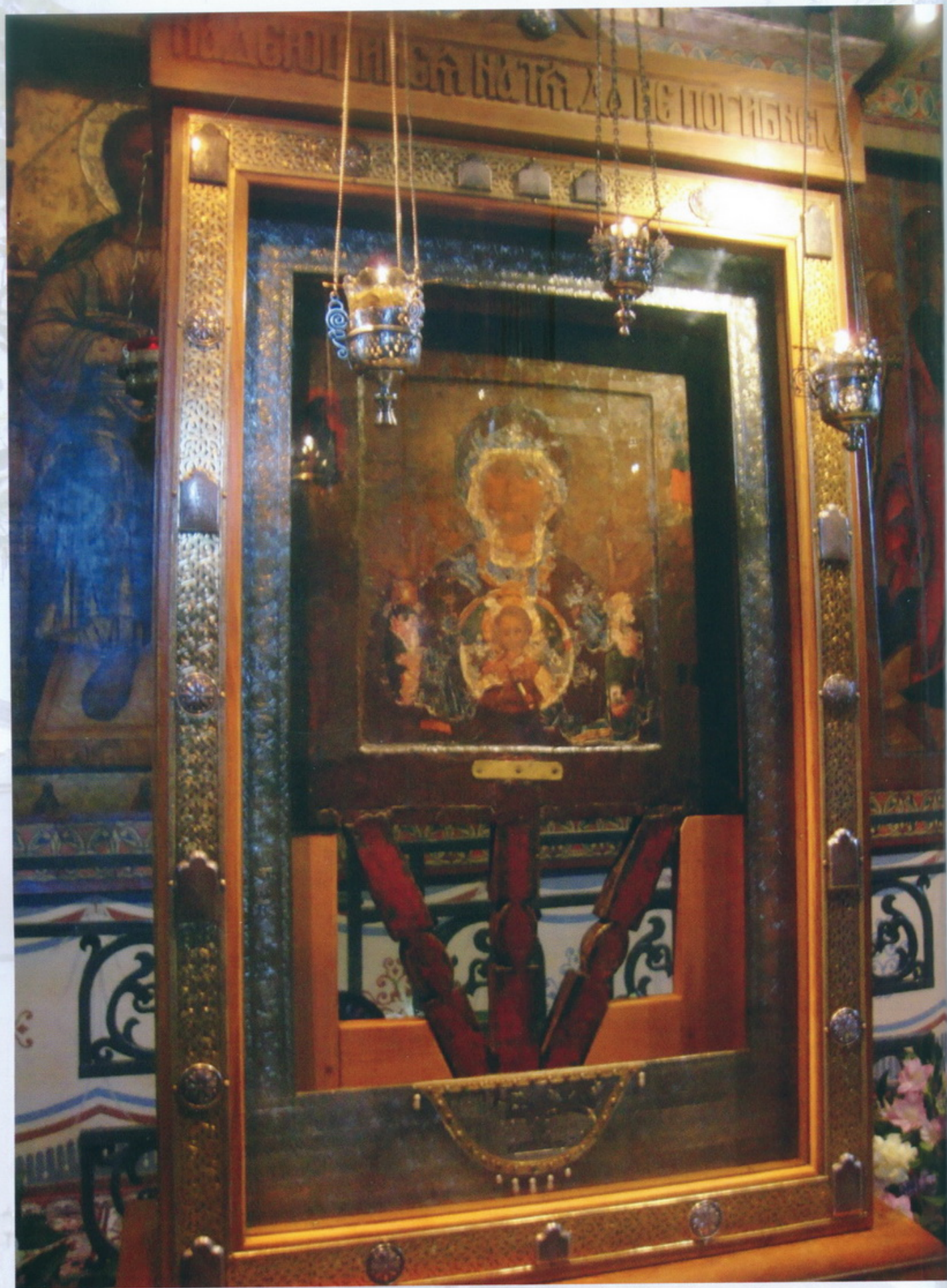
Великий Новгород Кремль Софийский собор Икона Божией Матери Знамени