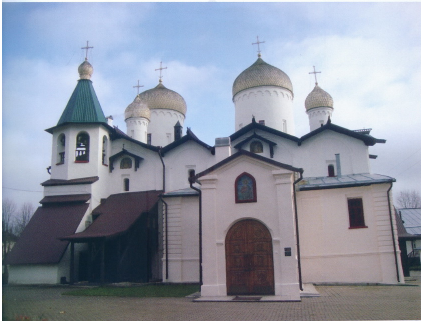
Великий Новгород Церковь апостола Филиппа и святителя Николая Чудотворца