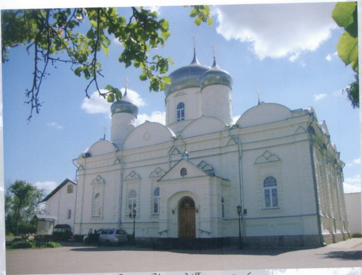
Великий Новгород Покровский собор

Между тем к старцу отовсюду продолжали стекаться и иноки, и миряне в надежде получить от него духовную пользу, ибо он, по апостолу, «всем был вся, всех наставляя, обо всех болезнуя и заботясь».