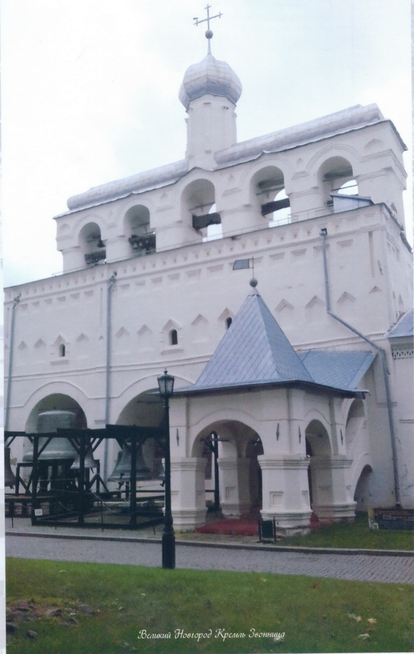
Великий Новгород Кремль Звонница