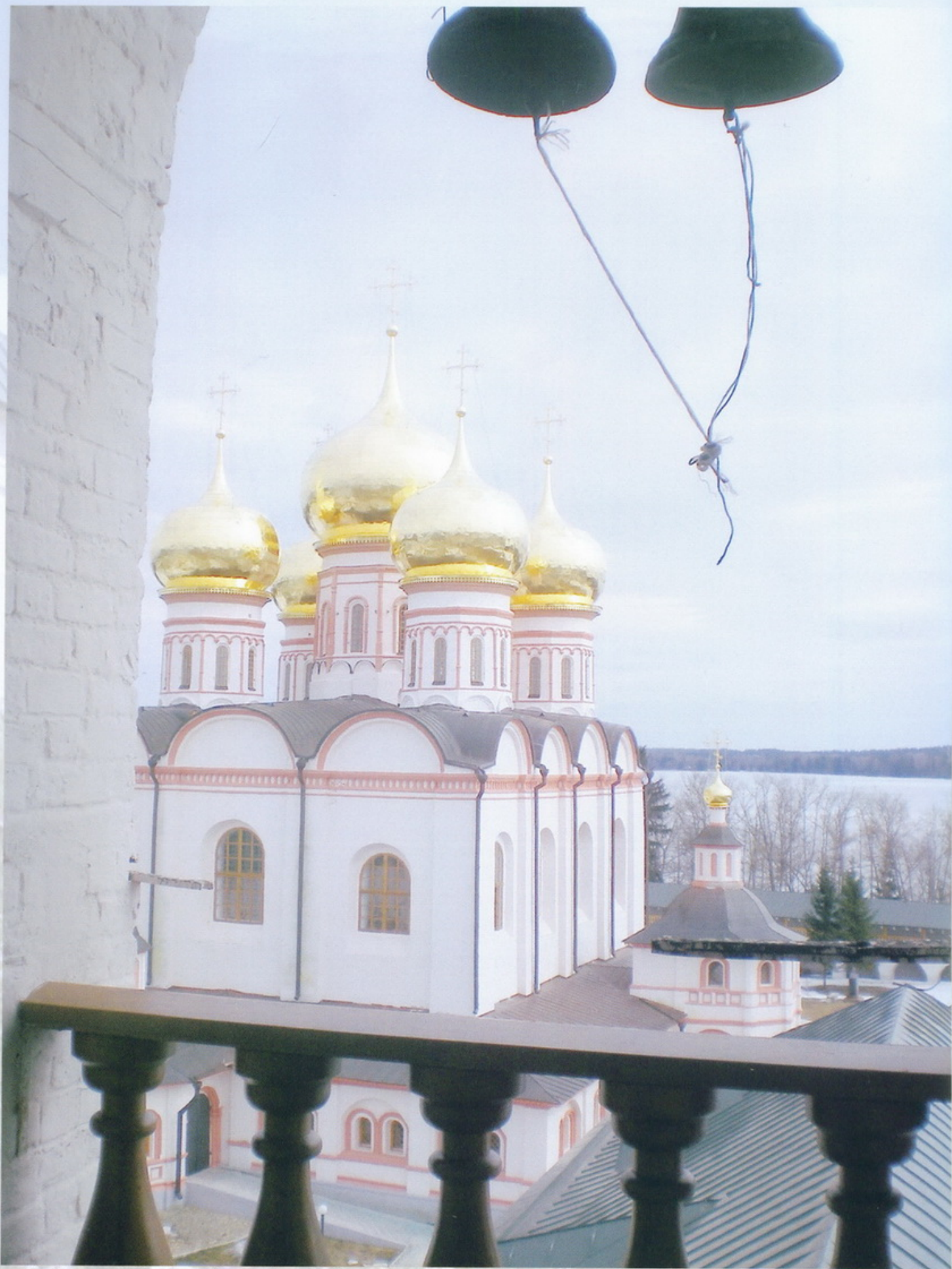
Валдайский Иверский Богородицкий Святоозерский мужской монастырь Иверский собор Вид с колокольни