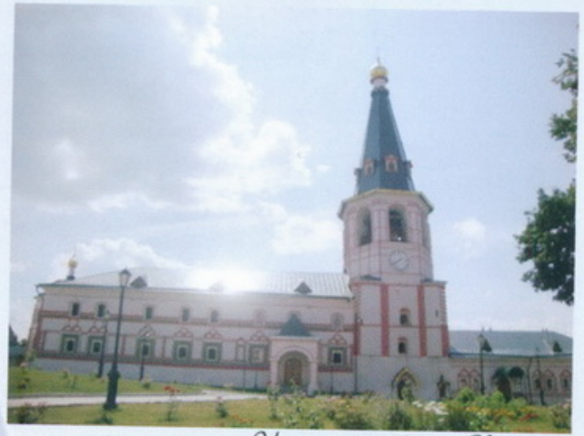
Валдайский Иверский Богородицкий Святоозерский мужской монастырь Иверский собор и Колокольня

Вдова на коленях стада умолять воинов пощадить икону и подождать до рассвета, пока она сможет собрать деньги на выкуп. Воины согласились, назвали огромную сумму для уплаты и не тронули икону, будучи смущёнными выступившей на ней кровью. Когда они ушли, вдова взяла святой образ и направилась с сыном к берегу моря. Доло молилась она и просила Царицу Небесную о милости к Её образу и о заступничестве за сына. Отпустив икону в воду, она с радостью заметила, что та не упала, а встала вертикально, ликом к берегу, и, скользя по водам, стала удаляться, пока не скрылась из вида.