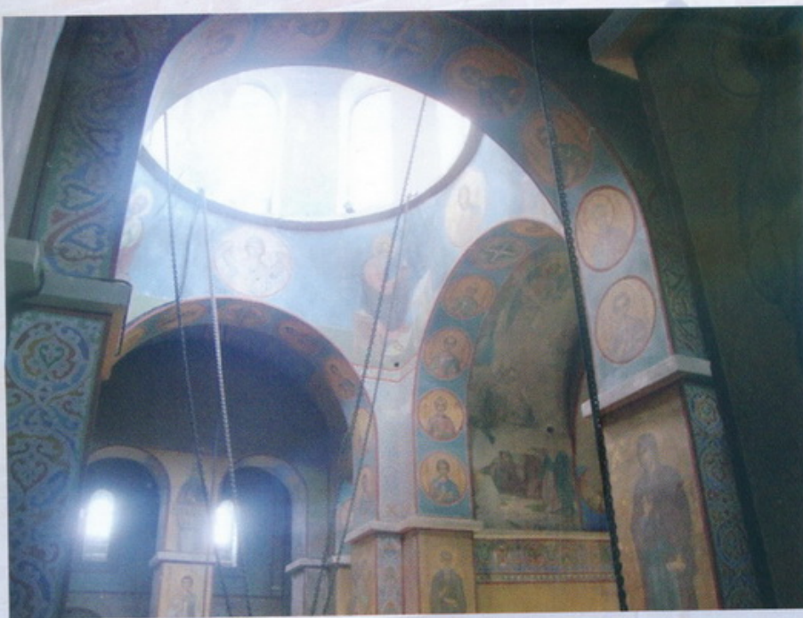
Великий Новгород Софийский собор Роспись собора

В XVI—XVIII столетиях библиотека кафедрального Софийского собора пополнялась за счет поступивших книг из церквей и монастырей Новгородской епархии: из Андреевского монастыря на Ситском острове в XVI веке поступило 13 книг, из них две Четыре книги — житие Андрея Юродивого и Пролог; из Хутынского монастыря — 11 книг. С XVII века в монастыре было свое книгописание. Среди книг, пополнявших Софийскую библиотеку из монастырей Новгородской епархии, особое место занимали книги Кирилло-Белозерского и Ферапонтова монастырей. Большинство списков памятников древнерусской литературы было сделано в этих монастырях.