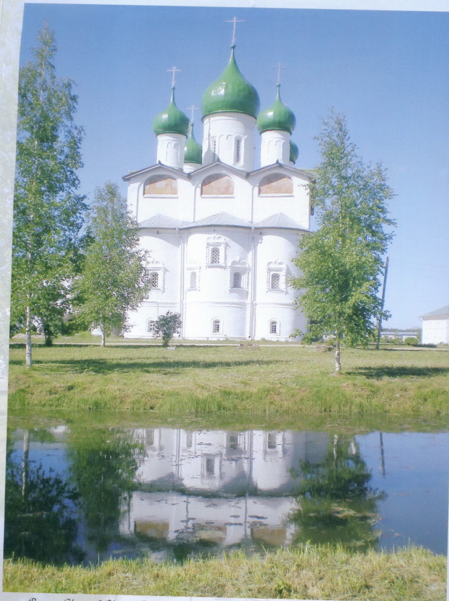
Великий Новгород Николо-Вязицкий ставропигиальный женский монастырь Никольский собор