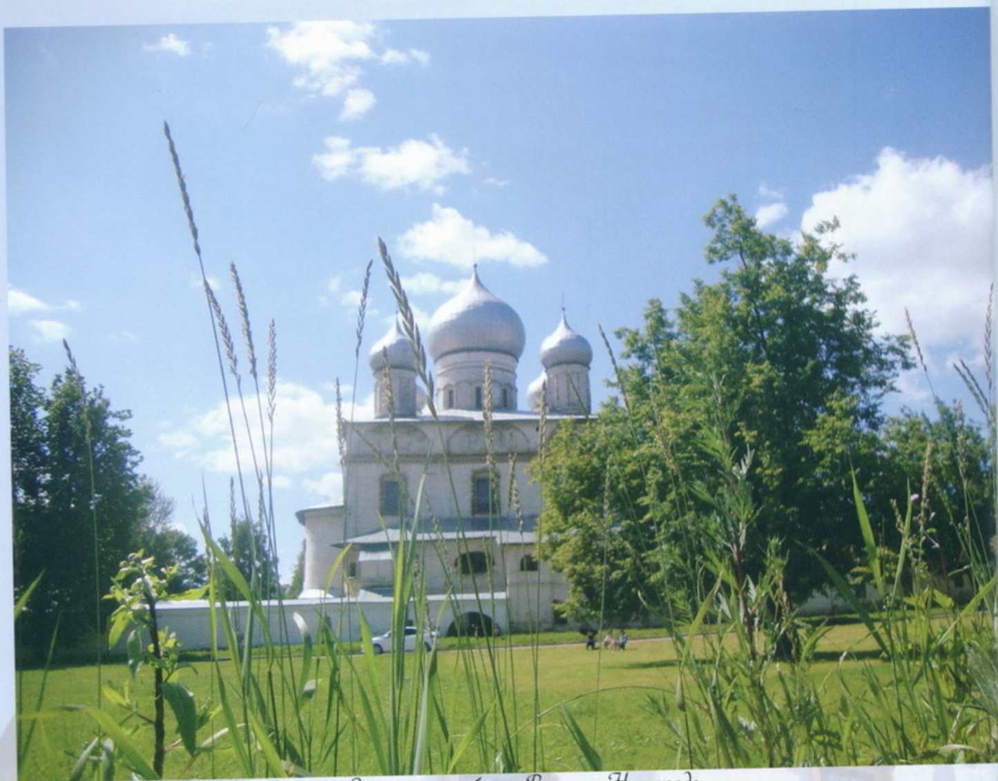
Знаменский собор в Великом Новгороде

Знаменский собор просторен и красив интерьером, обладает прекрасной акустикой, поэтому здесь нередко проходят концерты духовной хоровой музыки. Архитектурный памятник разительно отличается от большинства церквей, которые можно увидеть на новгородской земле.