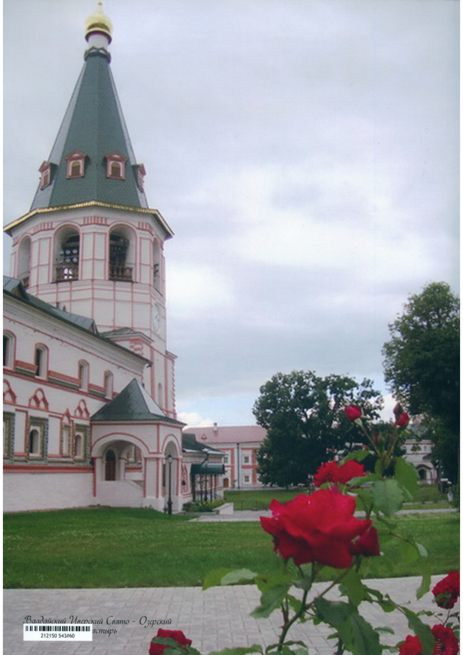
Валдайский Иверский Свято - Озерский монастырь