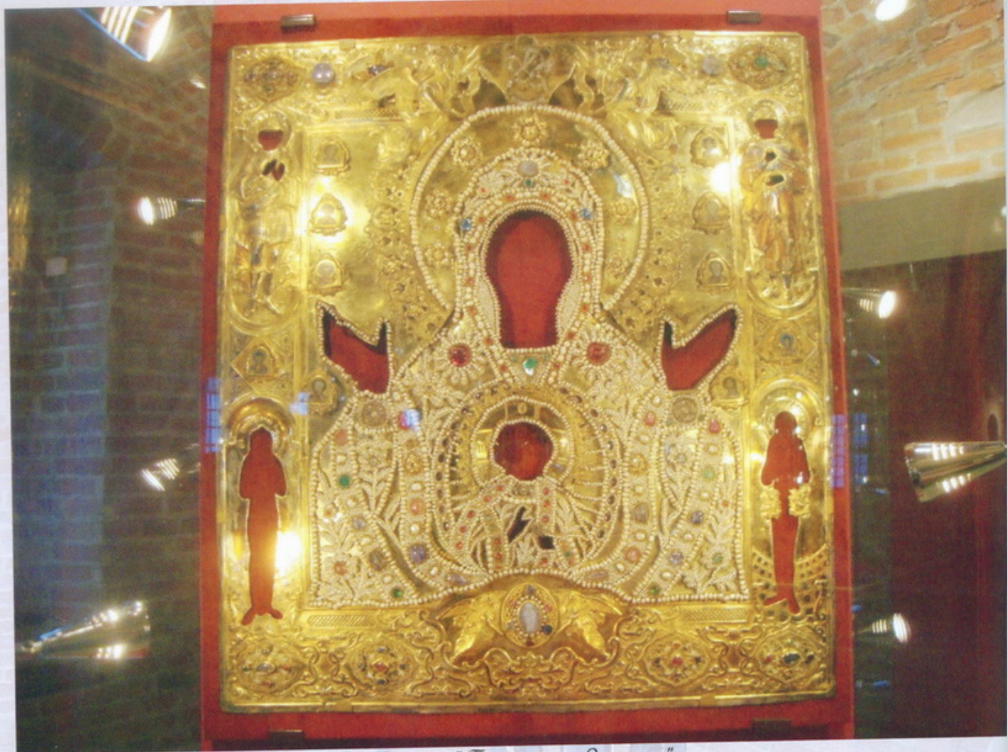
Оклад иконы "Богоматерь Знамение" Икона святителя Евфимия Новгородского с житием