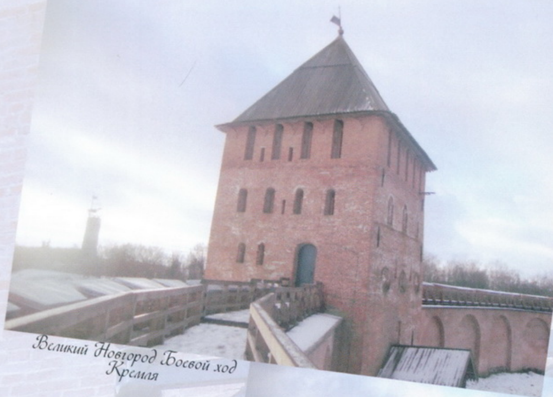
Великий Новгород Босвой ход Кремля