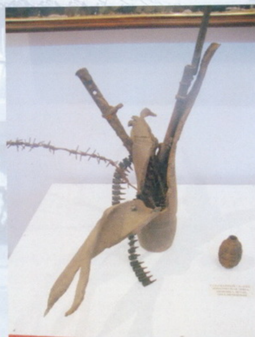
Экспонаты Зала воинской славы