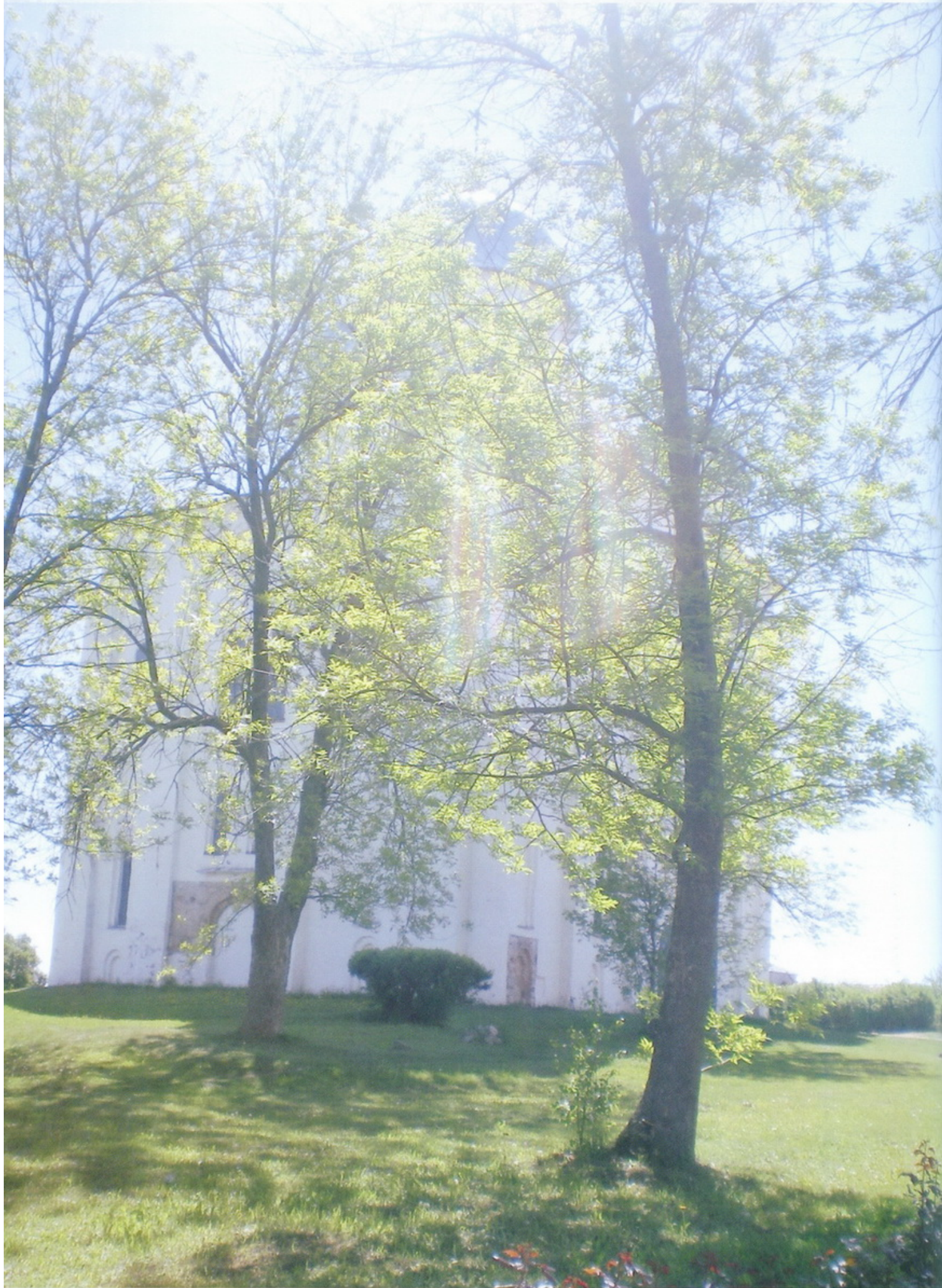
Великий Новгород Свято- Юрьев монастырь Троицкий собор