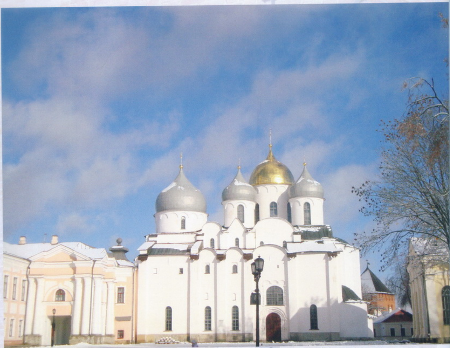
Великий Новгород Кремль Софийский собор