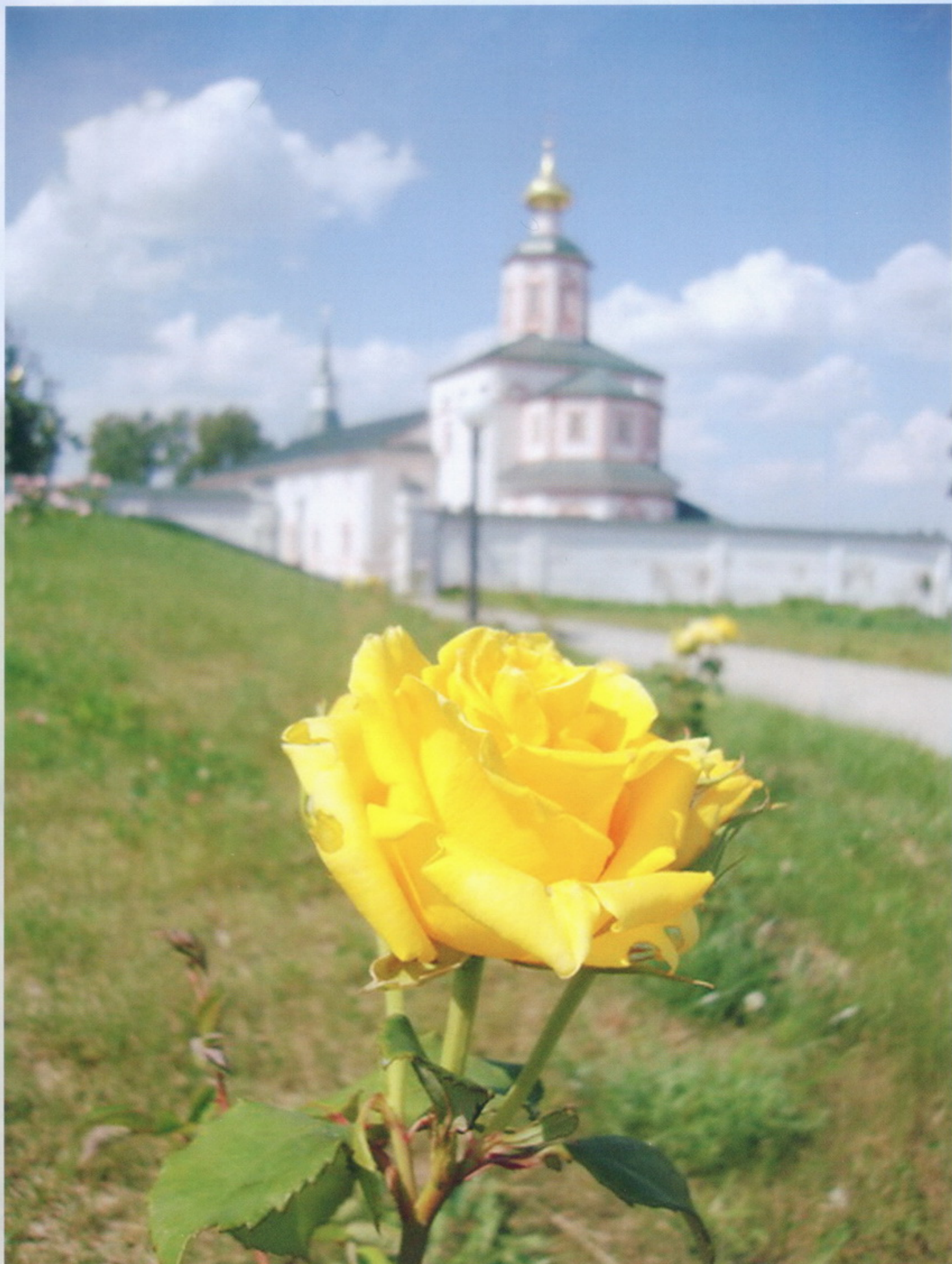
Валдайский Иверский Богородицкий Святоозерский мужской монастырь