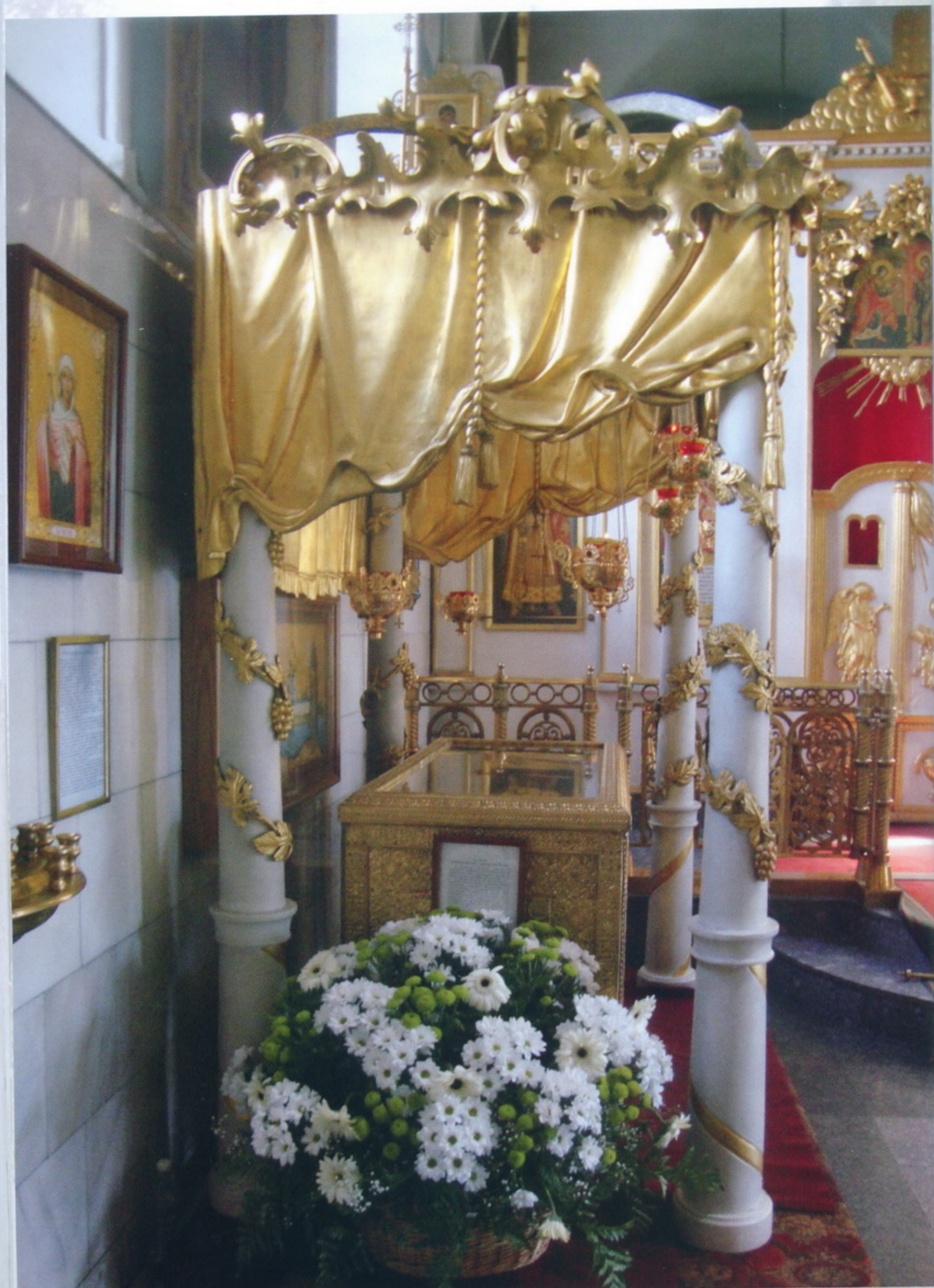
Рака с мощами преподобного Саввы Вишерского в Покровском соборе Великого Новгорода