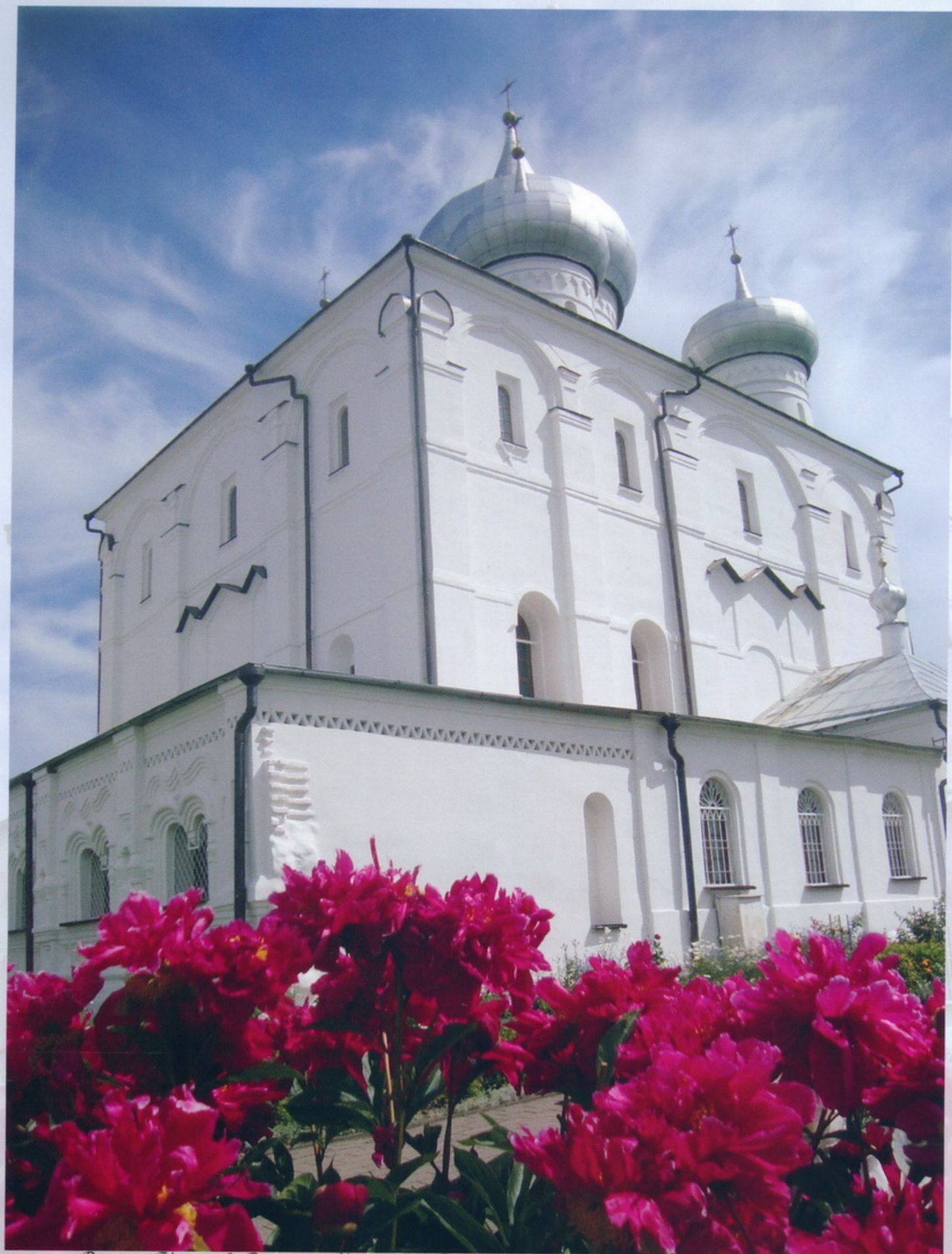
Великий Новгород Варлаамо-Хутынский Спасо-Преображенский женский монастырь Спасо - Преображенский собор