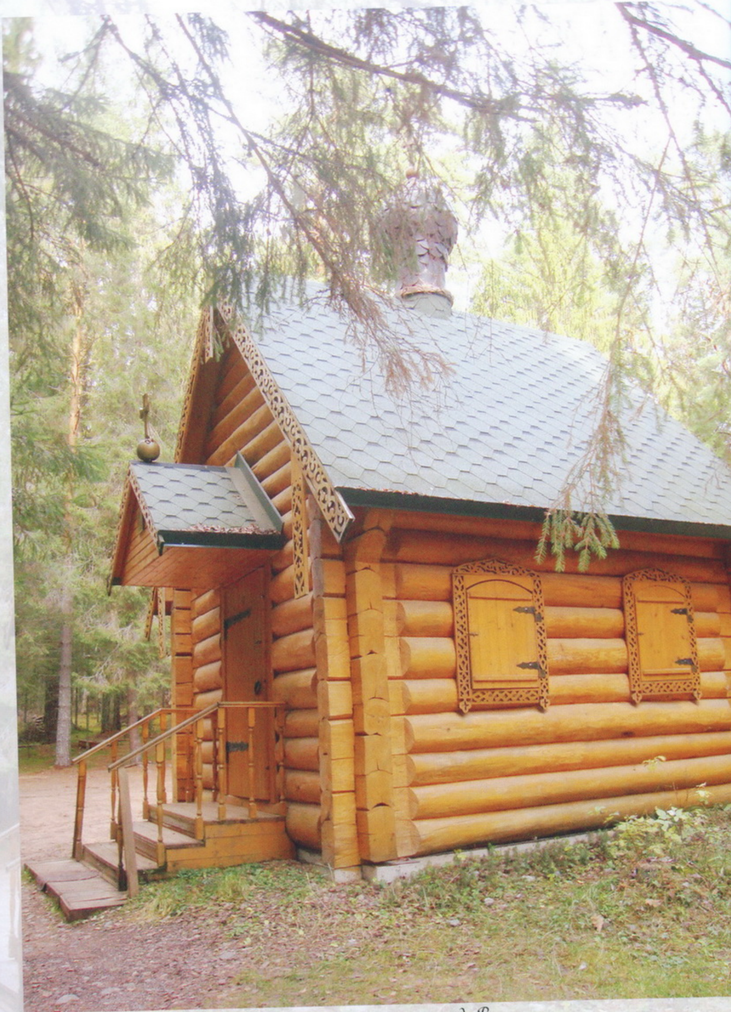
Часовня на святом источнике в д. Вычерма