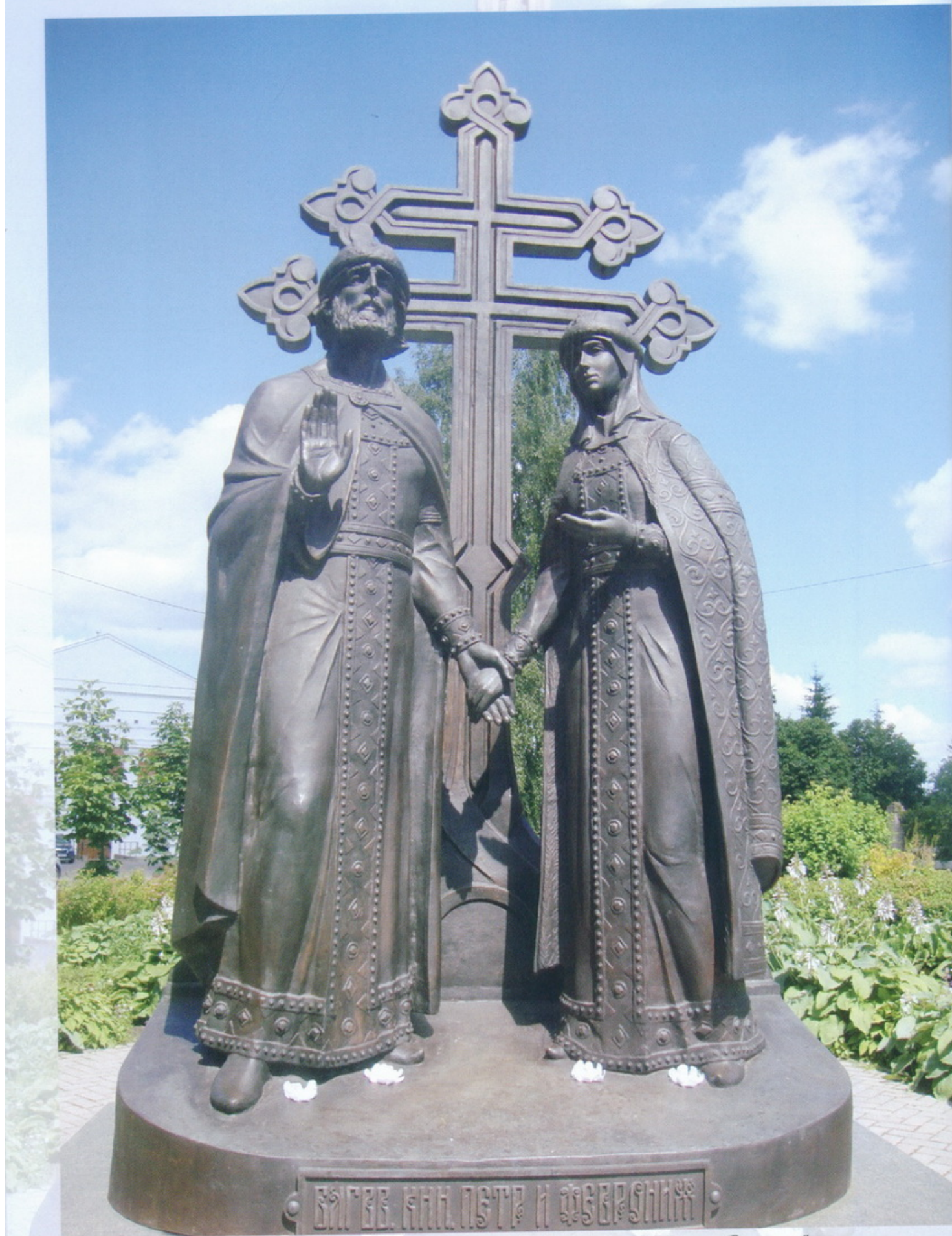
Великий Новгород Покровский собор Памятник "Петр и Феврония"