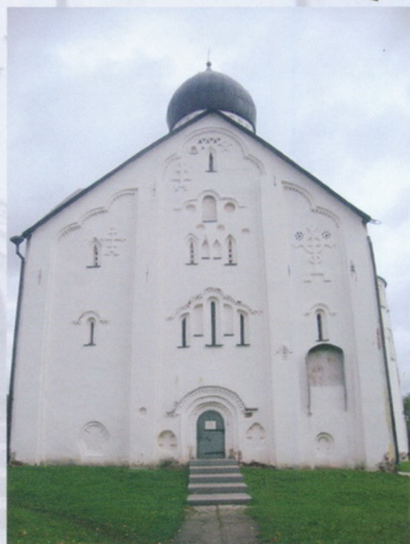
Спасо - Пресображенский собор