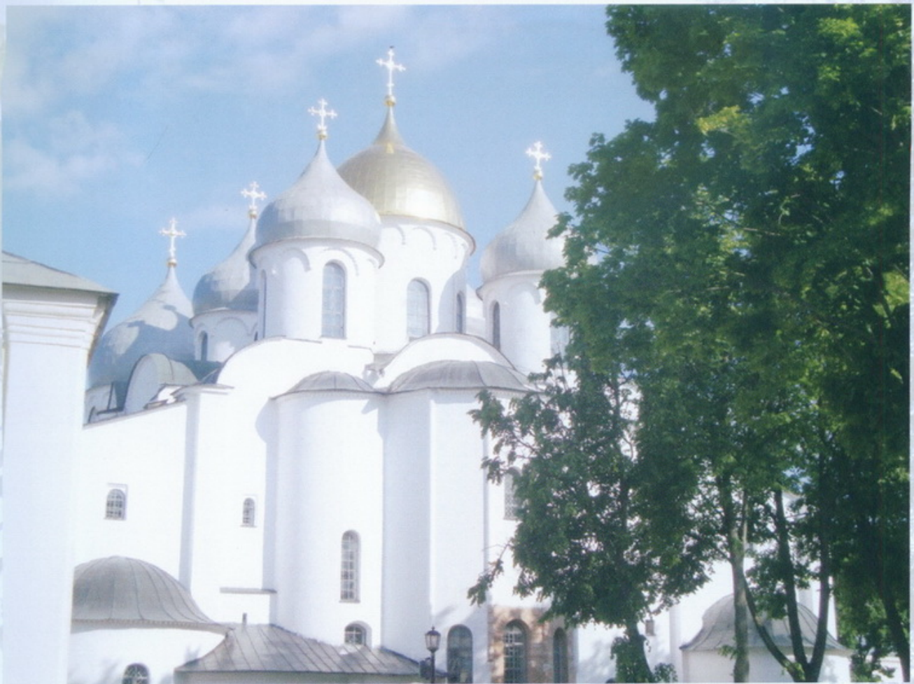
Великий Новгород Кремль Софийский собор

К числу уникальных экспонатов выставки относятся редчайшие образцы русской письменности: пергаменные грамоты XI – XII веков и Новгородская псалтырь – древнейшая славянская книга на восковых табличках, обнаруженная в слоях начала XI века.