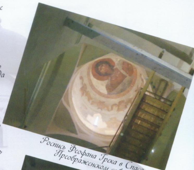
Роспись Феофана Грека в Спасо-Пресображенском соборе