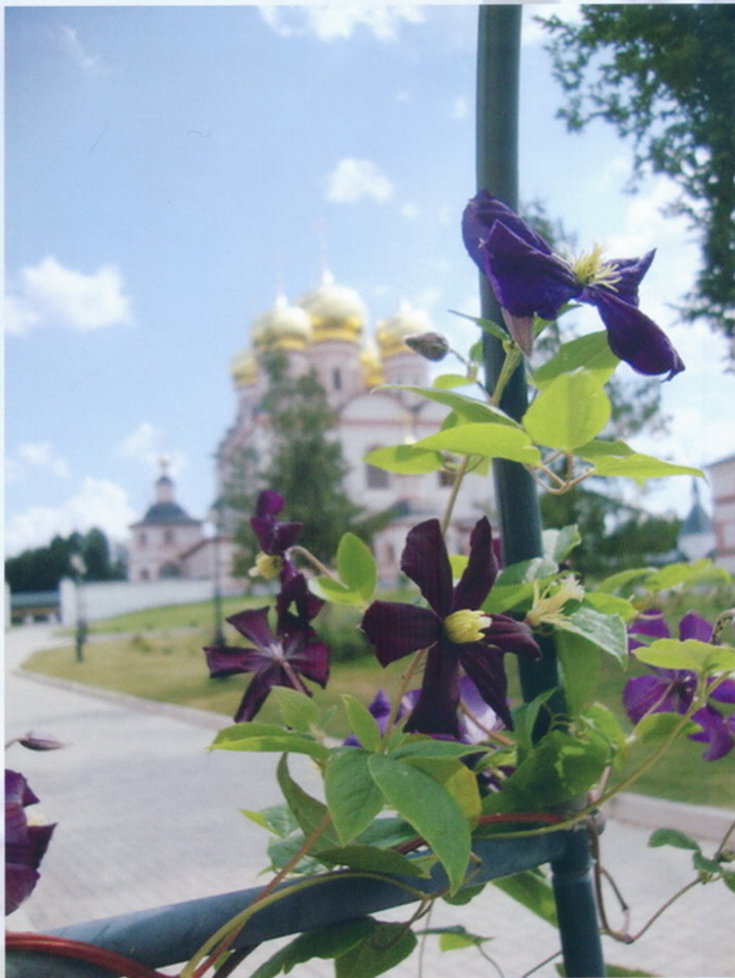
Валдайскі Іверскі Богородіцкі Святаозерскі мужскай манастыр