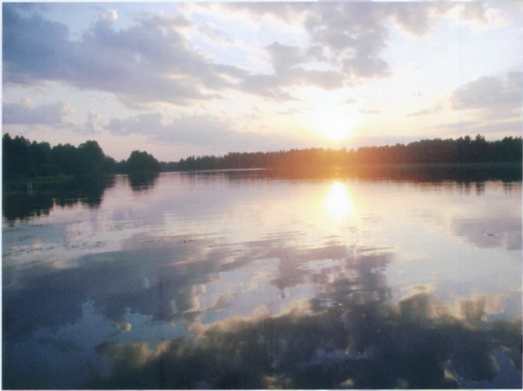
Валдайский Иверский Богородицкий Святоозерский мужской монастырь Закат на Святом озере

«Святой апостол и евангелист Лука, в то время, когда Пресвятая Матерь Божия жила ещё в Иерусалиме и обитала в Сионе, написал живописными средствами Её Божественный и честный образ на доске, дабы, как в зеркале, созерцали её последующие поколения и роды. Когда Лука представил Ей сие изображение, Она сказала: «Отныне ублажат Мя все роды. Благодать и сила Рождшагося от Меня и Моя с вами да будет». Предание приписывает кисти святого апостола и евангелиста Луки от трёх до семидесяти икон Божией Матери, в том числе и Иверскую.