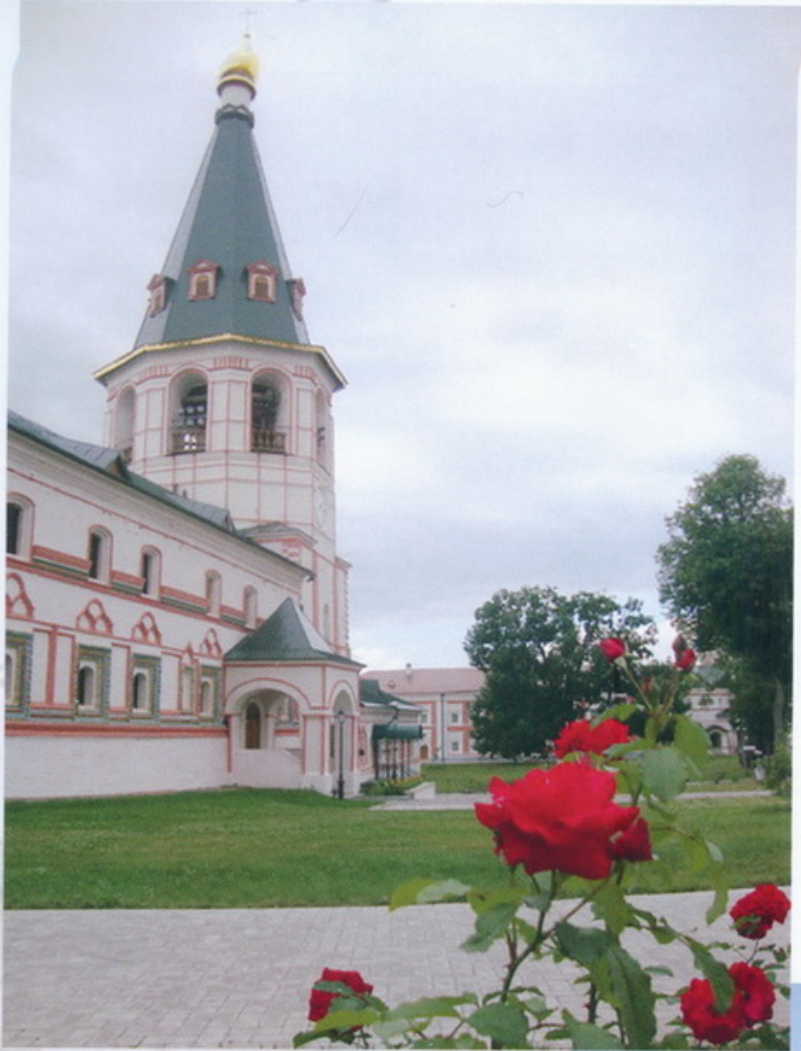
Валдайский Иверский Богородицкий Святоозерский мужской монастырь