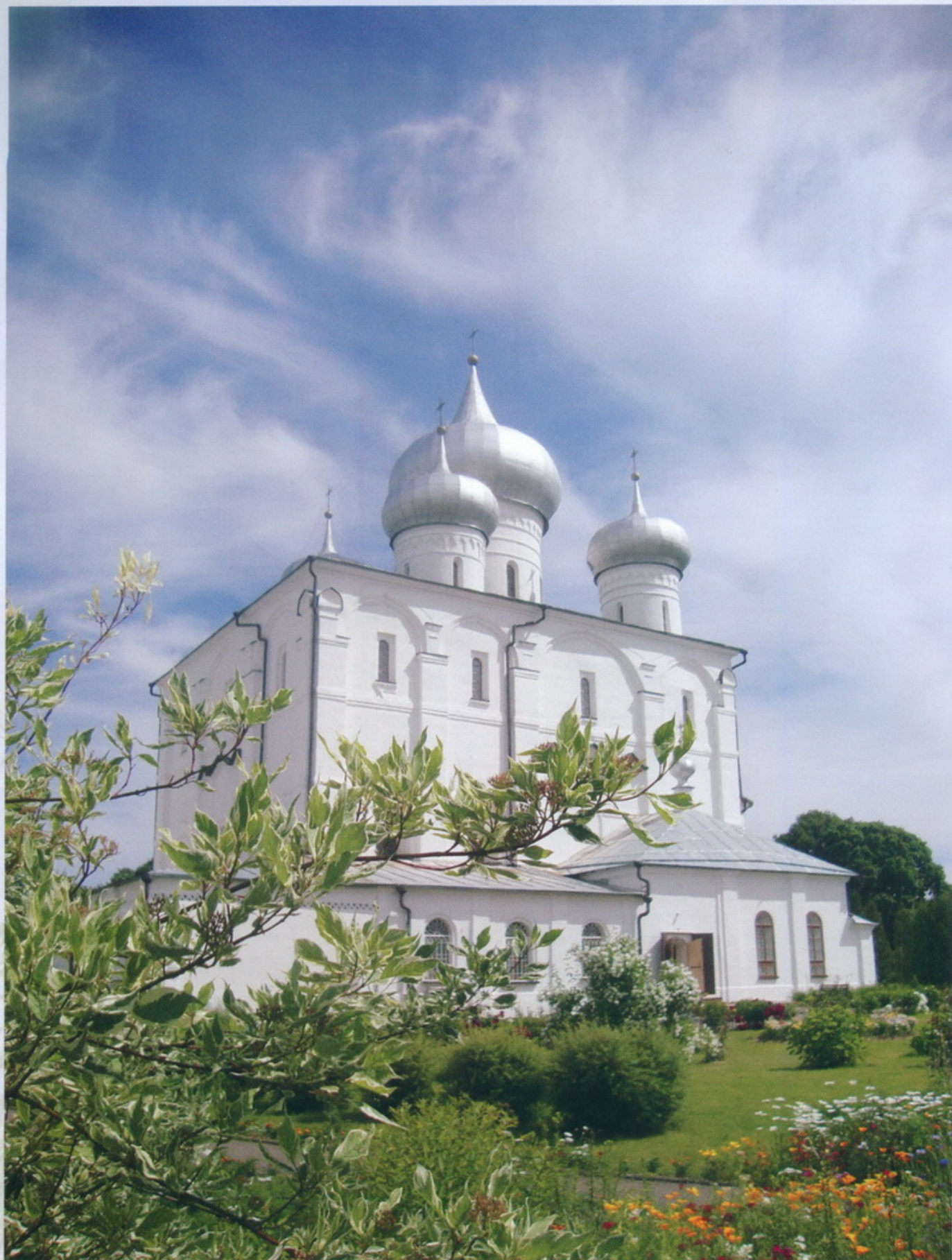
Великий Новгород Варлаамо-Хутынский Спасо-Преображенский женский монастырь Спасо - Преображенский собор

На протяжении многих веков монастыри имели большое значение в жизни новгородцев. Радует то, что благодаря заботам нашего батюшки Дмитрия мы смогли посетить и поклониться святыням Варлаамо — Хутынского Спасо-Преображенского женского монастыря и Николо — Вяжицкого ставропигиального женского монастыря Немного уставивше, но с большим чувством радости мы ехали домой. Ребята делились своими впечатлениями. Никто из посетивших эти дивные места не остался равнодушным к необыкновенной красоте этих Святых мест.